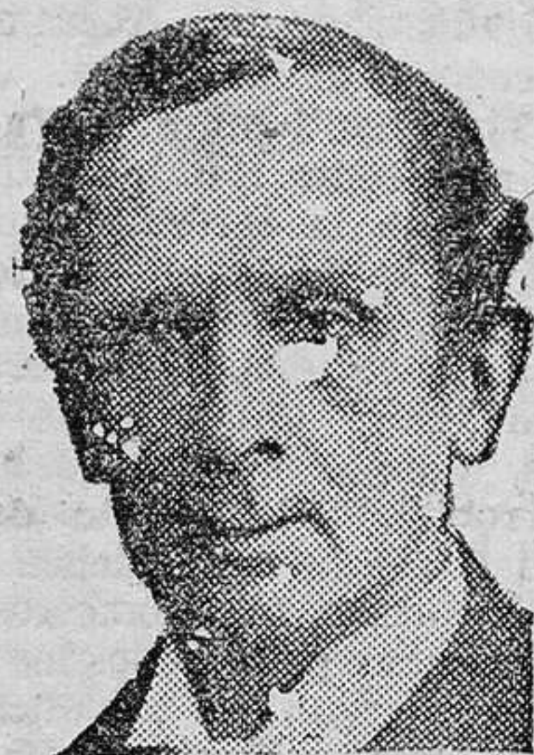
Cura recomendada por la gran autoridad médica Sir Morell Mackenzie.