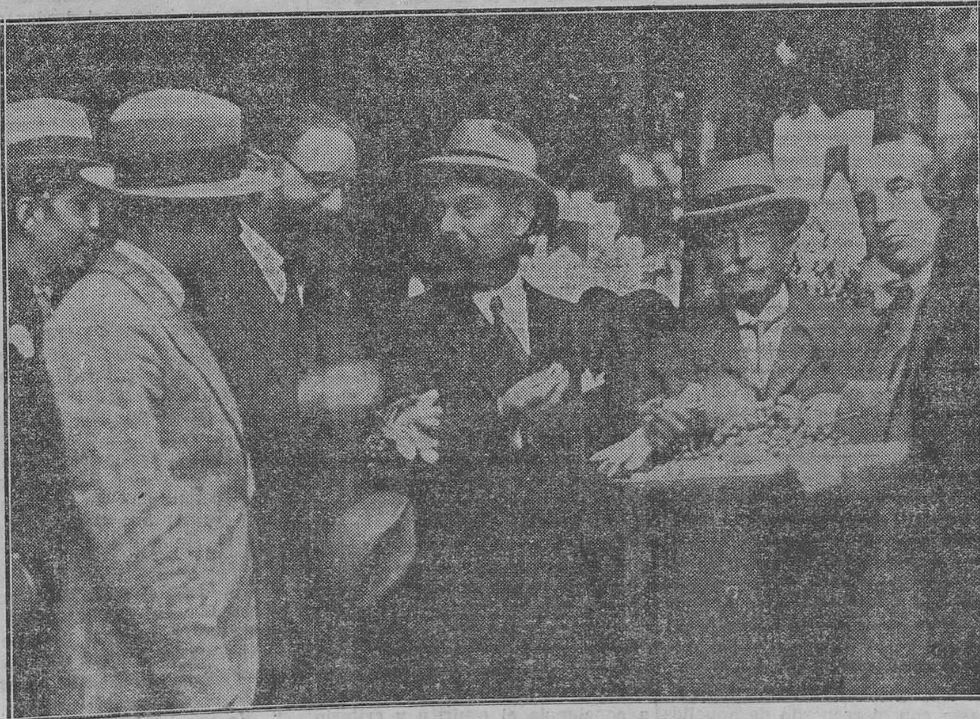
En el Palacio de Fontainebleau, la administración ha vendido, según costumbre, las célebres uvas de la llamada viña del Rey. Se vendieron 400 kilogramos entre los amateurs, que eran muy numerosos. En el grabado se ve al ministro M. Dumesnil probando las uvas junto a M. Matry, alcalde de Fontainebleau