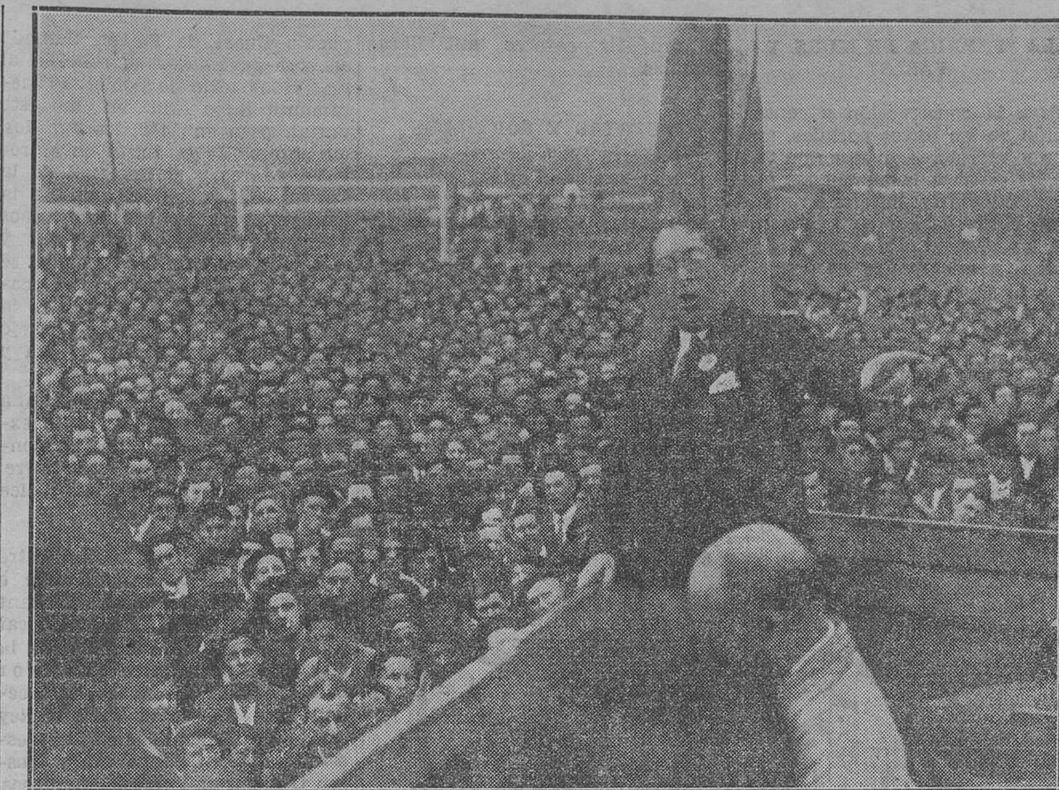
El señor Ortega y Gasset pronunciando un discurso de propaganda política en Bilbao

Durante la Comuna de París (primavera de 1871), el jefe del Poder ejecutivo de Francia, monsieur Thiers, dijo: "No temo el comunismo en Europa, mientras en Londres haya un Gobierno de orden". Tanta importancia tenía aún para la política del Continente el Gobierno inglés. Hoy, la importancia de Londres pierde un cierto porcentaje en provecho de París. Los Soviets tenían la misma opinión que Thiers, y por esta razón dirigían su principal esfuerzo contra Londres. Pero hoy, Francia tiene mucho más oro que Inglaterra y por su ejército y los de sus aliados domina el Continente. Sin embargo, Moscú no ataca directamente a París, por el contrario, hace todo para aproximarse a Francia. La Rusia Soviética—como tantos otros países—necesita dinero y espera encontrarlo en París. Así se explica en gran parte su tentativa de firmar con Francia un pacto de no-agresión. En realidad, entre Francia y Rusia no existen divergencias de intereses; la antigua alianza franco-rusa lo demuestra. Sin embargo, Francia no puede comprometerse a no atacar en ningún caso a Rusia; en efecto, Francia es aliada de Polonia y si Rusia atacara a este país, tendría que socorrerla. Es menester, pues, que Rusia firme también con Polonia un pacto de no-agresión. Por otra parte, Polonia es aliada de Rumania, y quiere que esta potencia