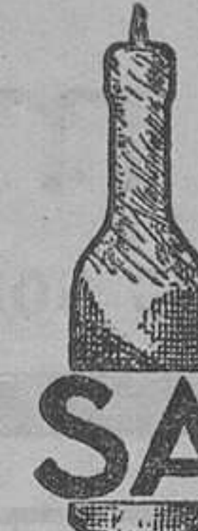
Venta en farmacias

—Cuido mi estómago, que es la base de la salud, y aunque por la vida moderna tenga algún desorden en mis comidas, en cuanto noto la menor molestia, unas veces ardor o dolor de estómago, otras pesadez en la digestión, etc., tomo durante unos días, muy pocos, el famoso Elixir Saiz de Carlos y aquellas molestias desaparecen por completo y puedo seguir comiendo los alimentos más variados. No lo olvide,