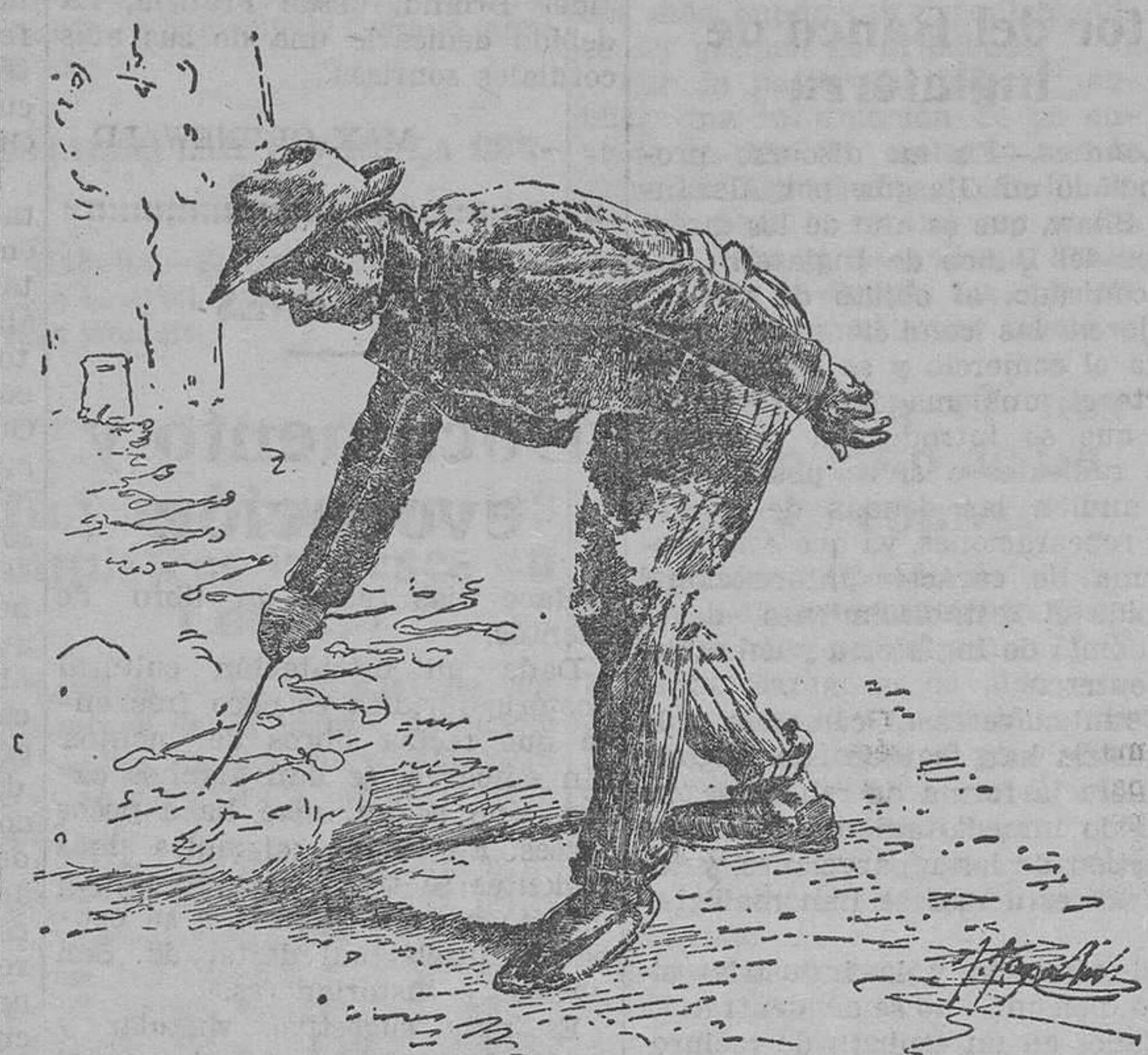
UN "CUETER" DE ANTAÑO

propio, ser artista, conocer la física, la química, las matemáticas y el dibujo, todavía no puede llamarse pirotécnico sin exponerse a ir a la cárcel.