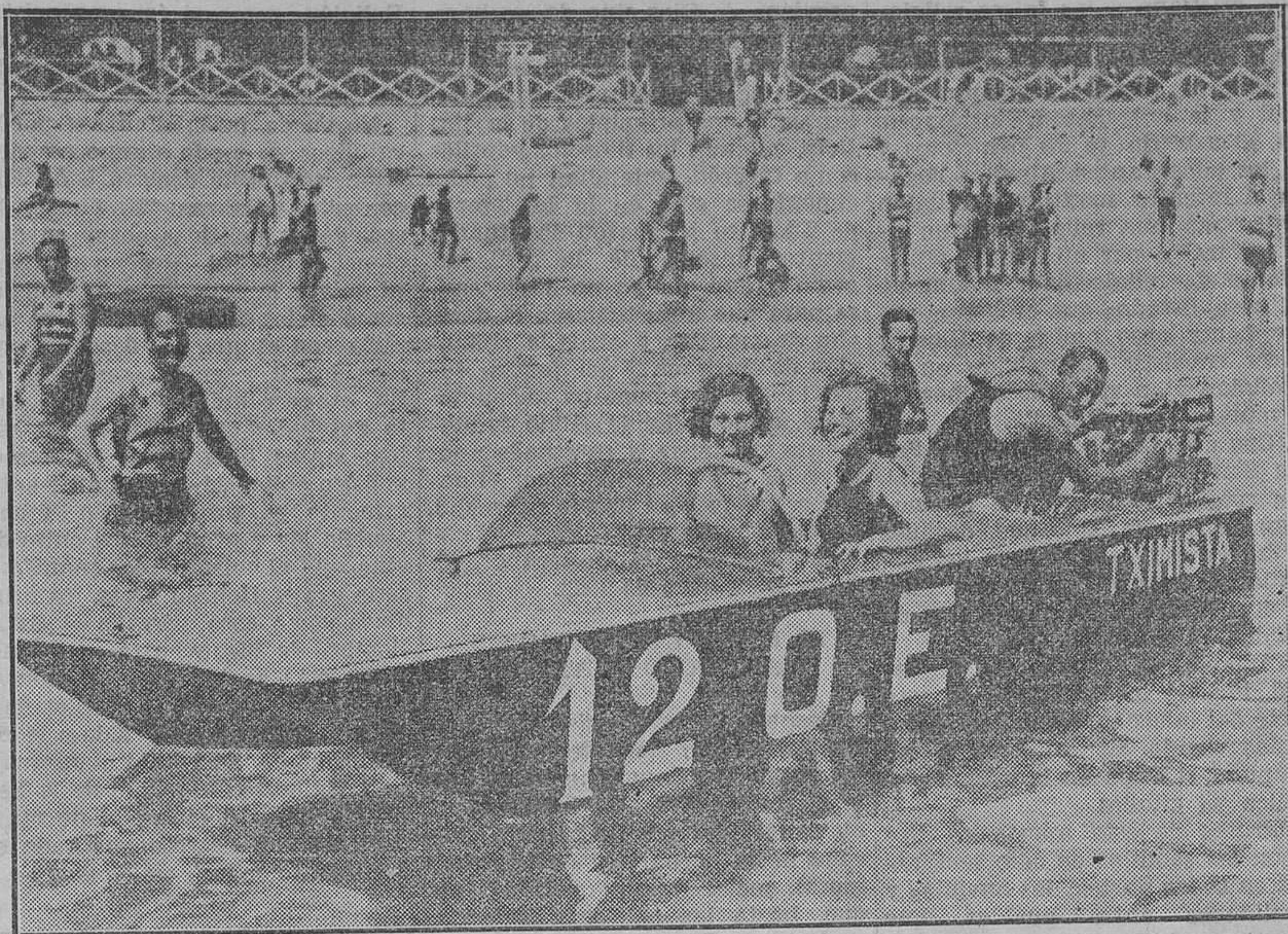
Señoritas preparadas para tomar parte en las regatas que se están celebrando estos días