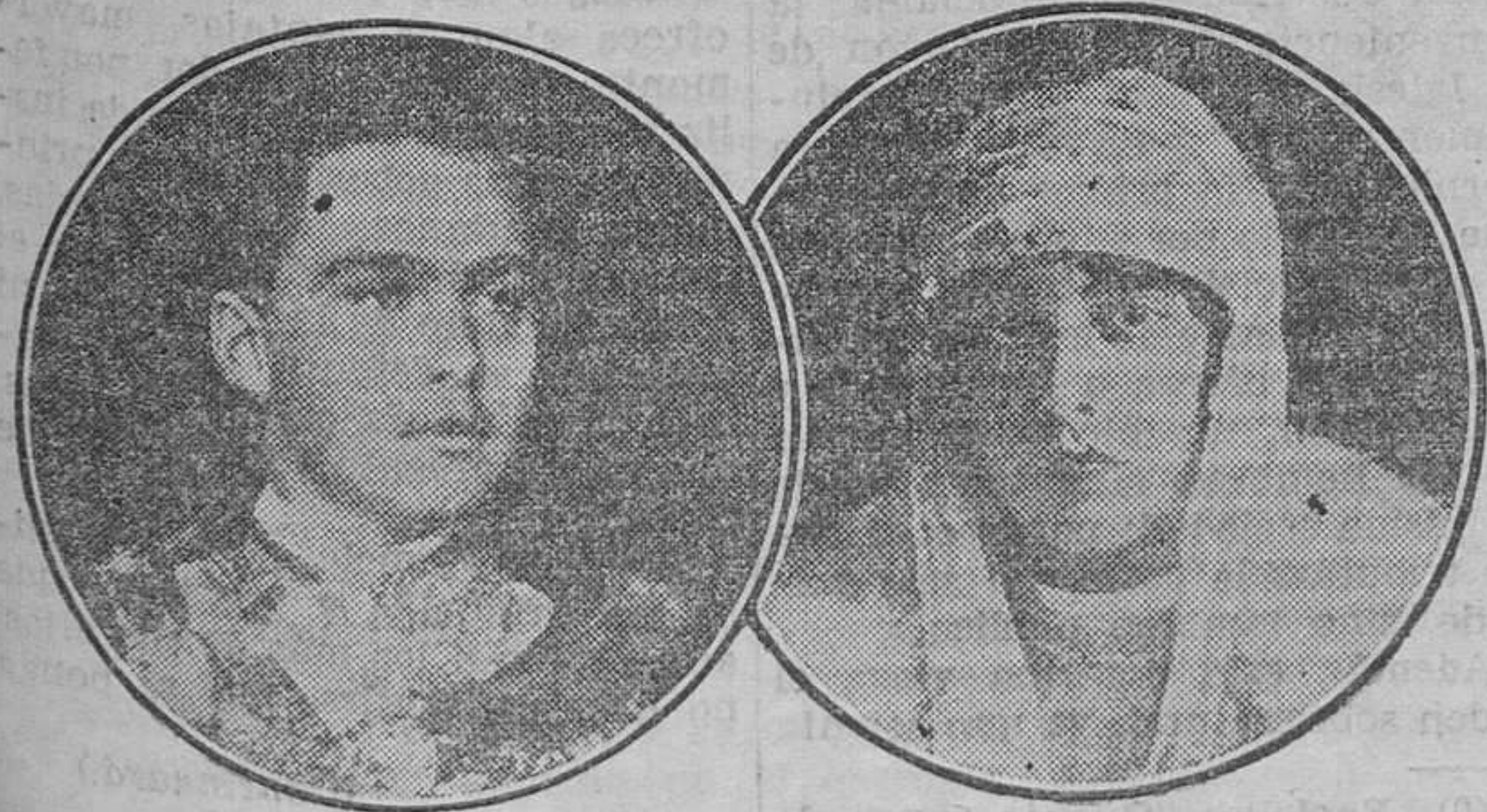
El Príncipe Otto de Habsburgo y la Princesa María de Saboya, hija menor de los Reyes de Italia, Principes que se dice contraerán matrimonio en breve