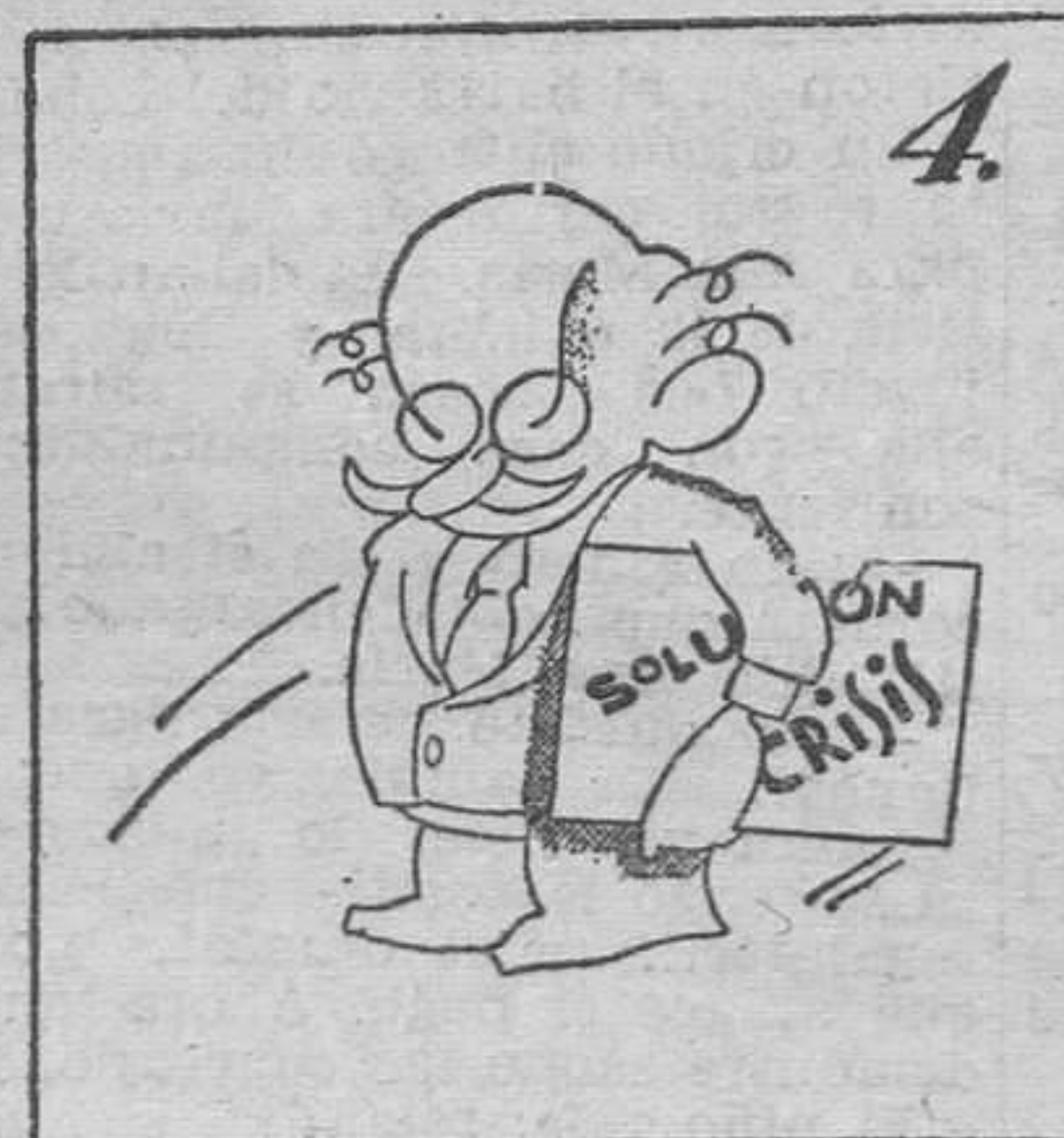
A una crisis espontánea, la solución... "instantánea".