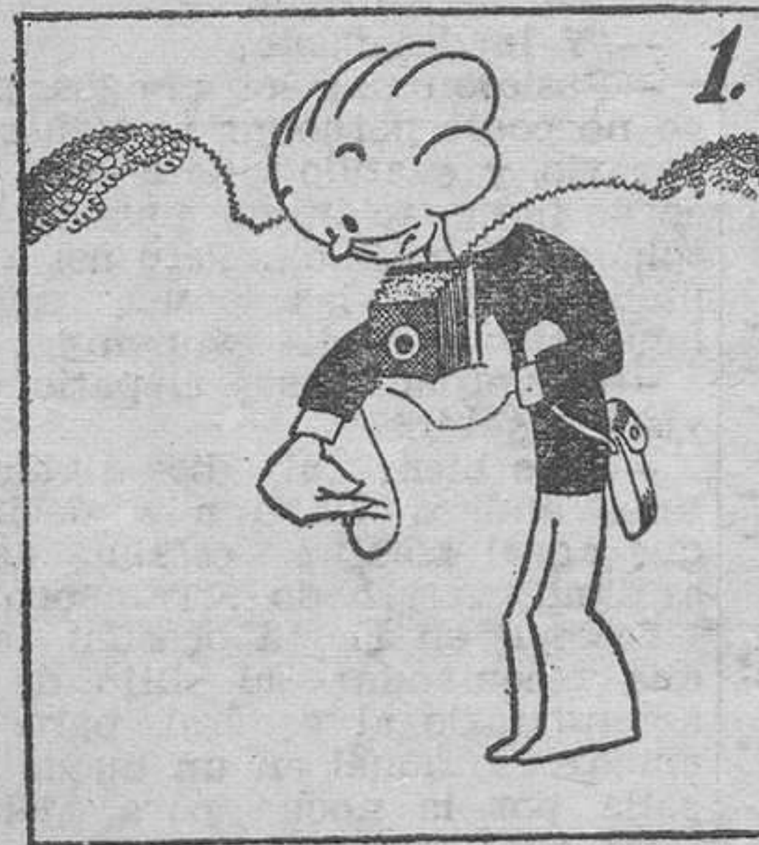
Ved la actualidad del día, vertida a fotografía.