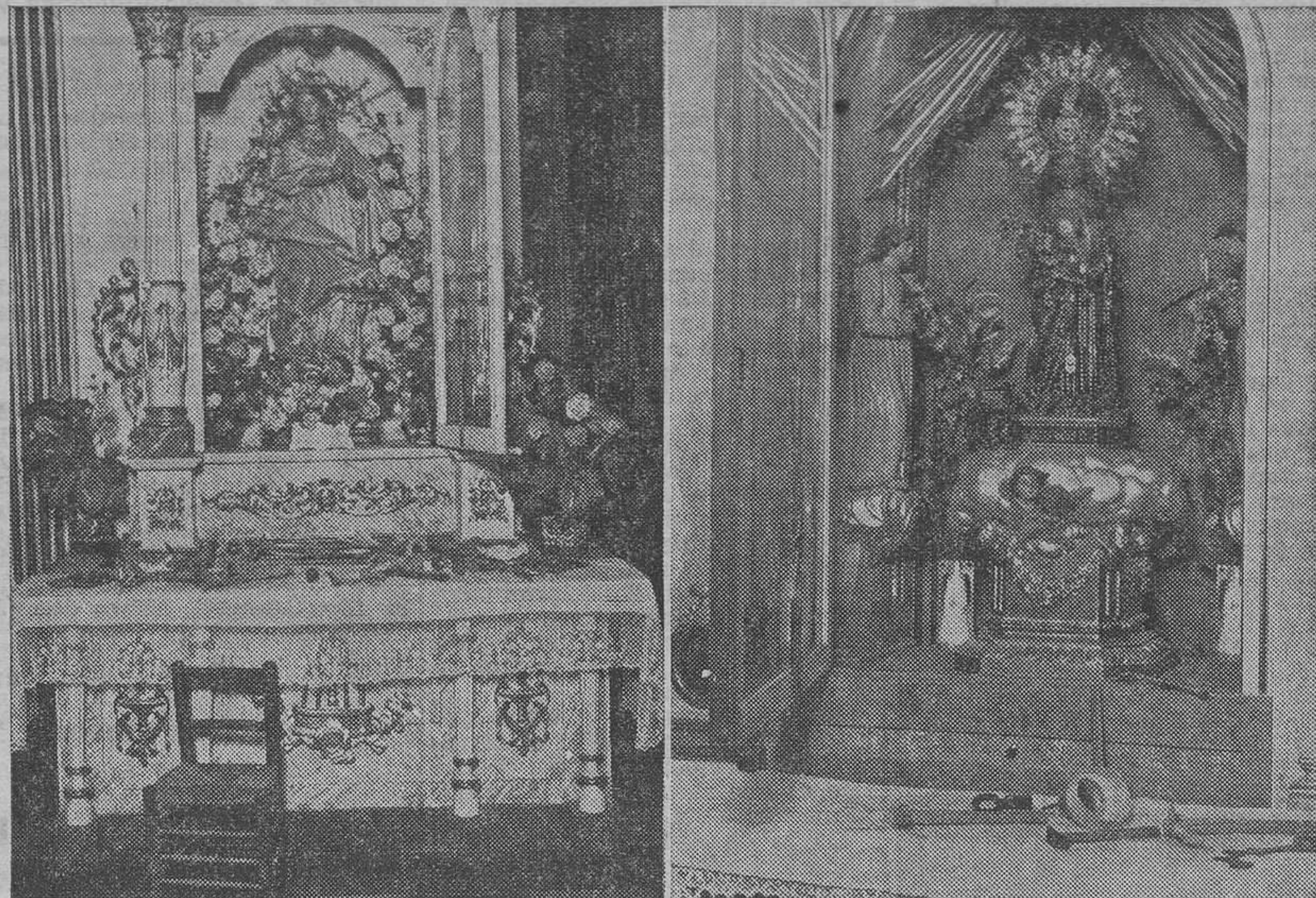
Las capillas de la Purísima y de Nuestra Señora del Oreto, Patrona de la villa, tal como las dejaron los ladrones, después de haber realizado el robo, con las herramientas que utilizaron.