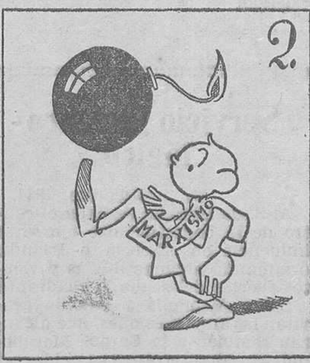
2. A este chiquillo verás, ese "juego" y muchos "Marx".