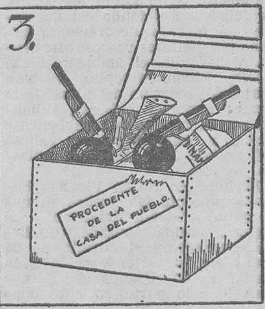
3. Y considera, Facundo: Hay que ver cómo está el "mundo".