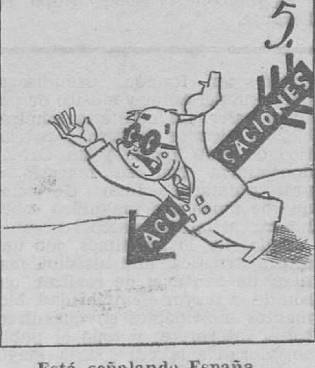
5. Está señalando España como muy culpable, a Azaña.