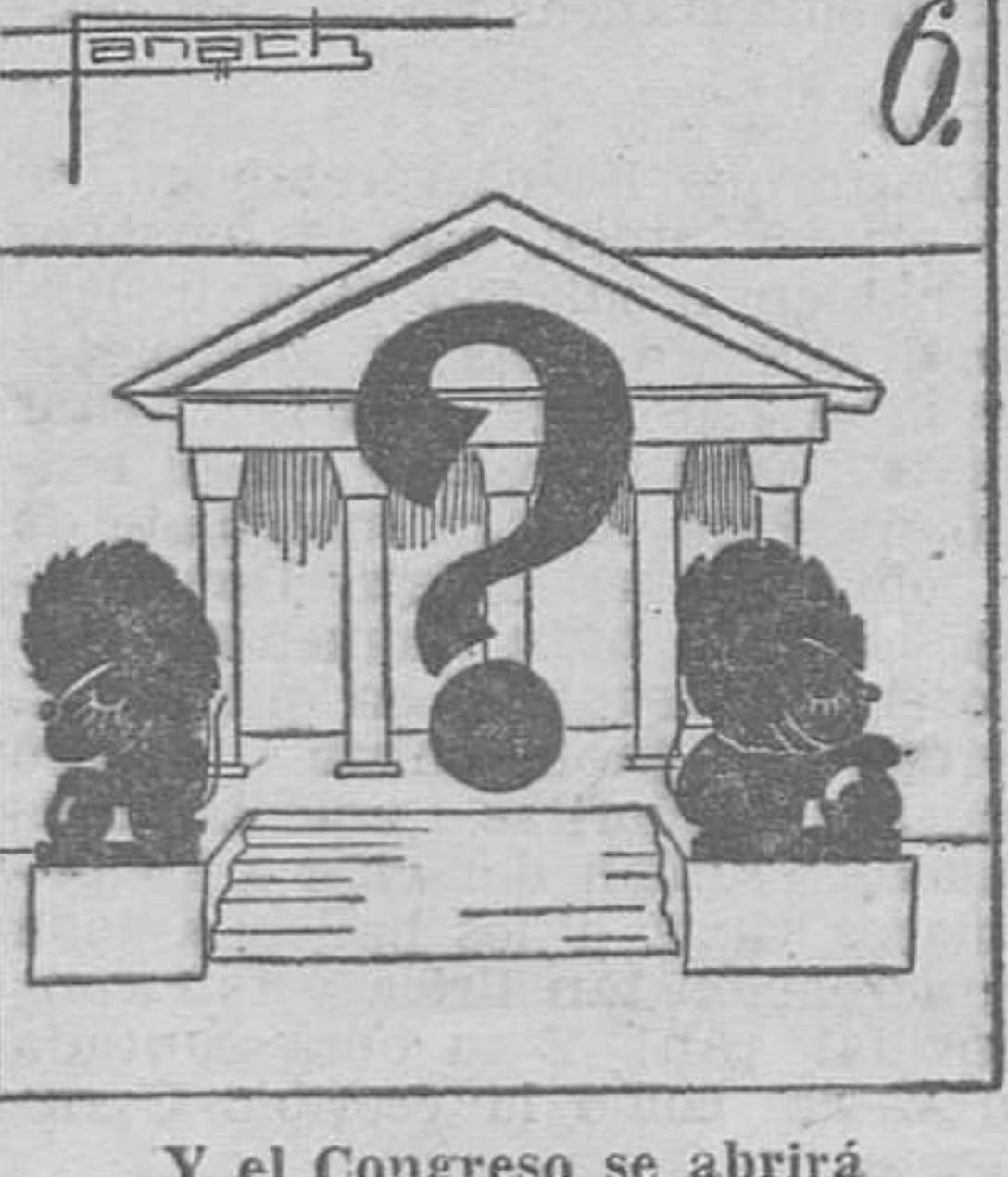
6. Y el Congreso se abrirá mañana... ¿Qué pasará? (Texto y monos de Panach.)