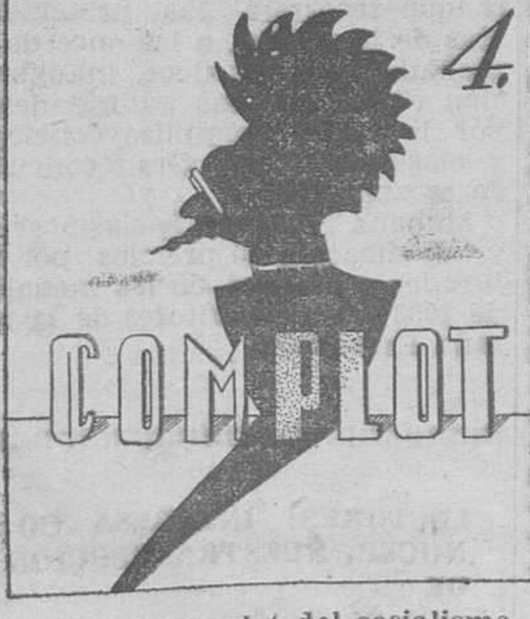
4. Fué el complot del socialismo con gotas de soviétismo.