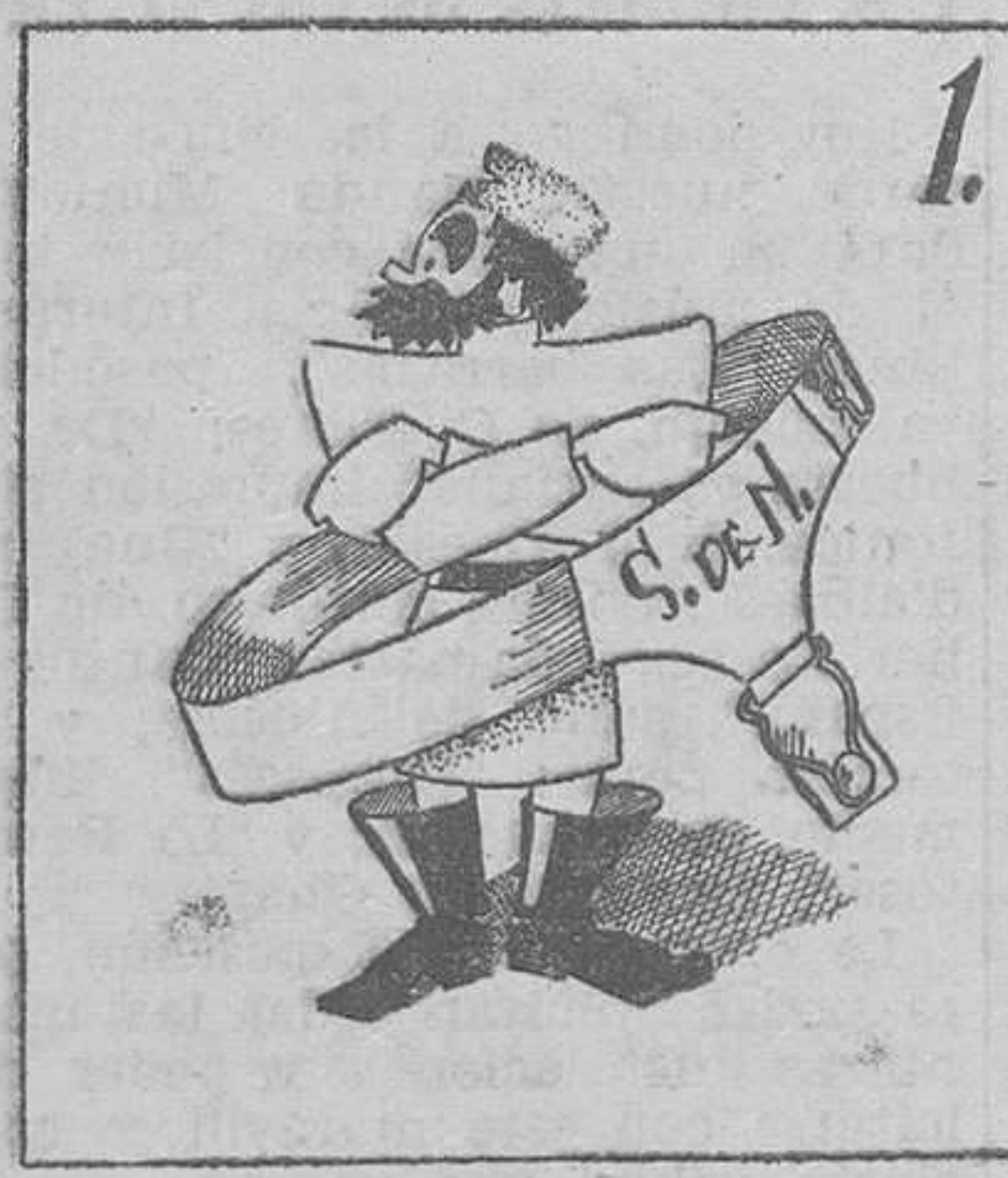
1. Digase lo que se diga, Rusia ya ha entrado en la Liga.