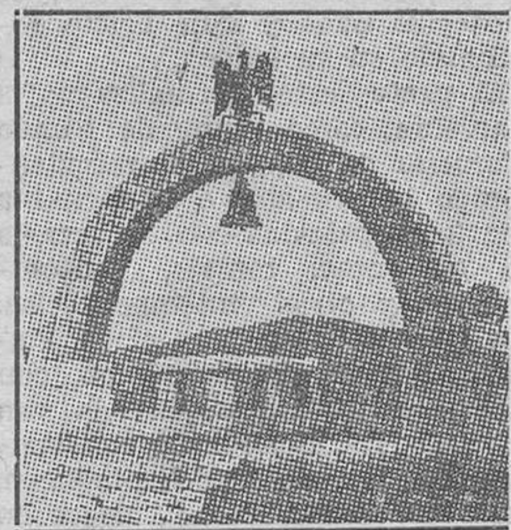
El monumento conmemorativo de la batalla famosa, recientemente inaugurado en Roncesvalles

Con motivo de celebrarse el centenario del descubrimiento en Oxford del manuscrito de la canción de gesta famosa, se erigió un monumento en el punto donde se dió la batalla que costó la vida al famoso Roldán (u Orlando, o Rolando, que de las tres maneras lo escriben los autores castellanos). Con tal motivo ha habido excursiones, fiestas cívicas, discursos, remembranzas históricas y gran número de artículos en diarios y revistas.