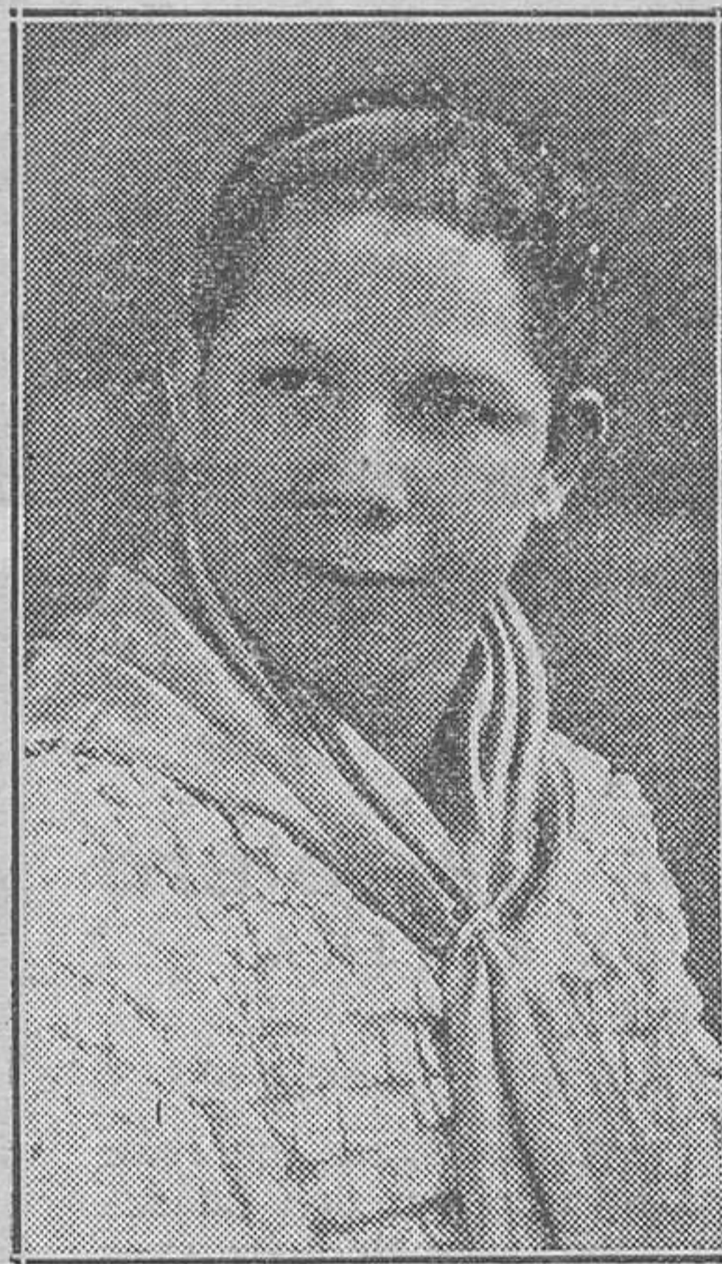
Eduardo Brito, barítono divo, que el día 14 del corriente inaugurará la temporada de Apolo

cación, y zarzuela, comedia, música de todos los géneros, canto y baile tornarán la próxima temporada a brillar en nuestra sala de espectáculos, consagrada a Febo. Queden los cines en lo que son y los teatros vuelvan a resurgir, que hay público para todo.