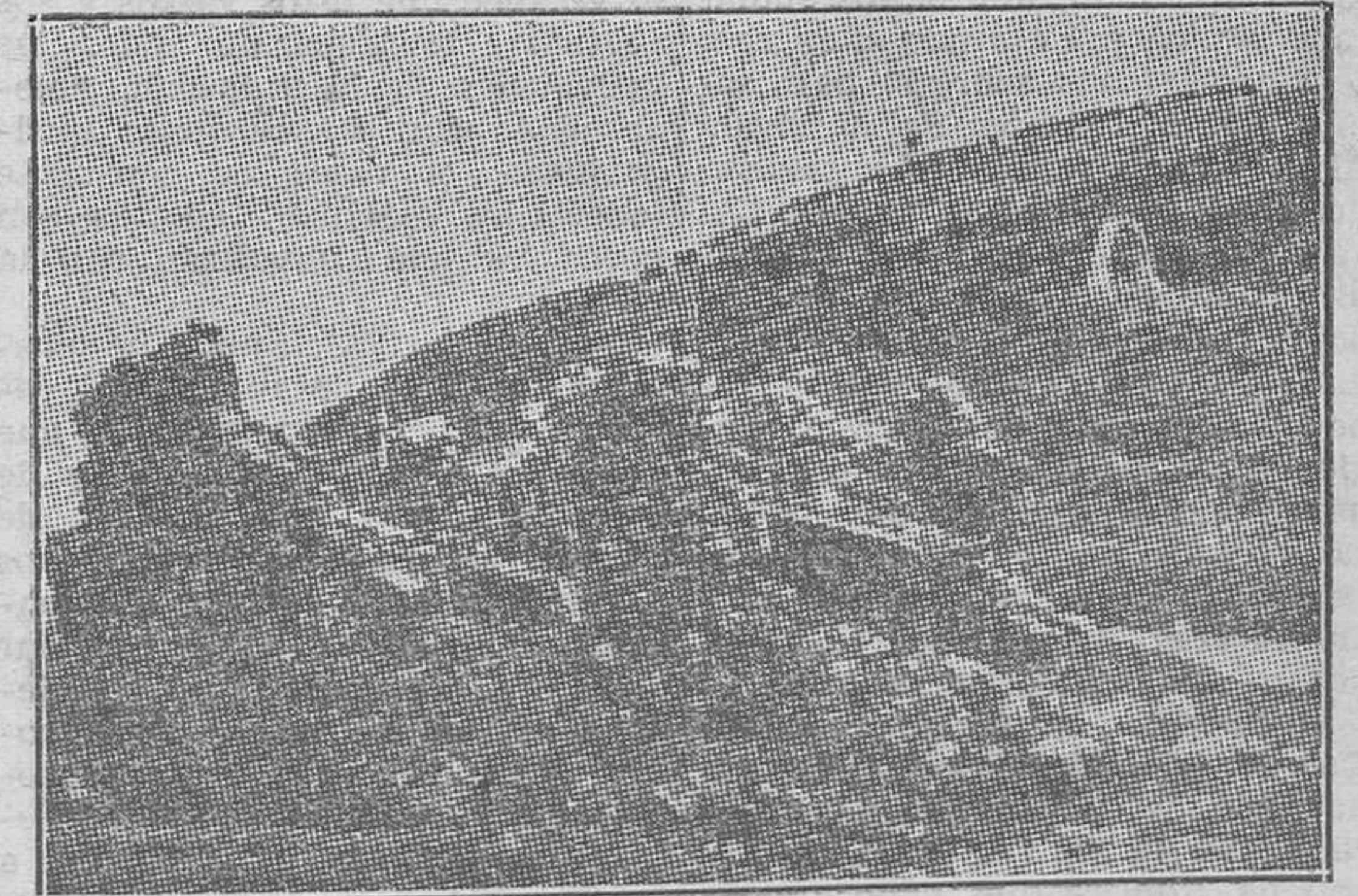
Ruinas de la capilla de Carlo-Magno erigida en Roncesvalles, y en donde han sido hallados los esqueletos, que se suponía fueran los de Orlando y sus Pares de Francia

El hecho de Roncesvalles fué la derrota de las tropas de Carlomagno, cuando vino a España. Cuantas veces cruzaron sus ejércitos los Pirineos, les fué funesto el paso. Ahora bien: ¿por qué vino a España Carlomagno y por qué la derrota de Roncesvalles? Sin duda por "redondear" sus dominios de la llamada "Marca hispánica", apoderándose de las ciudades importantes, como Pamplona, Zaragoza y Barcelona. El momento era propicio; esas tierras