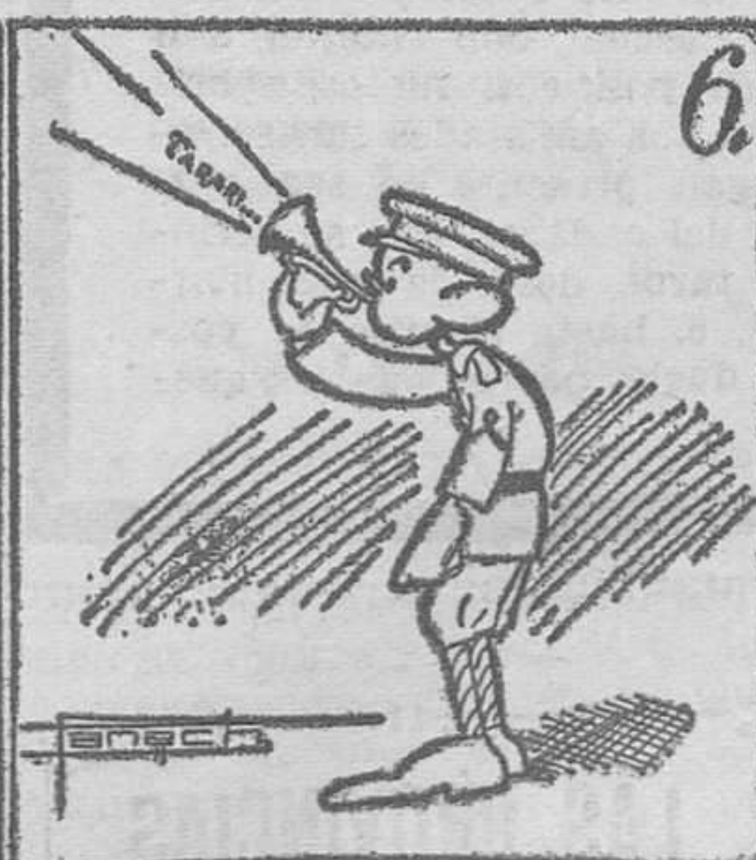
Se ha causado sensación, con la movilización. (Texto y monos de Panach.)