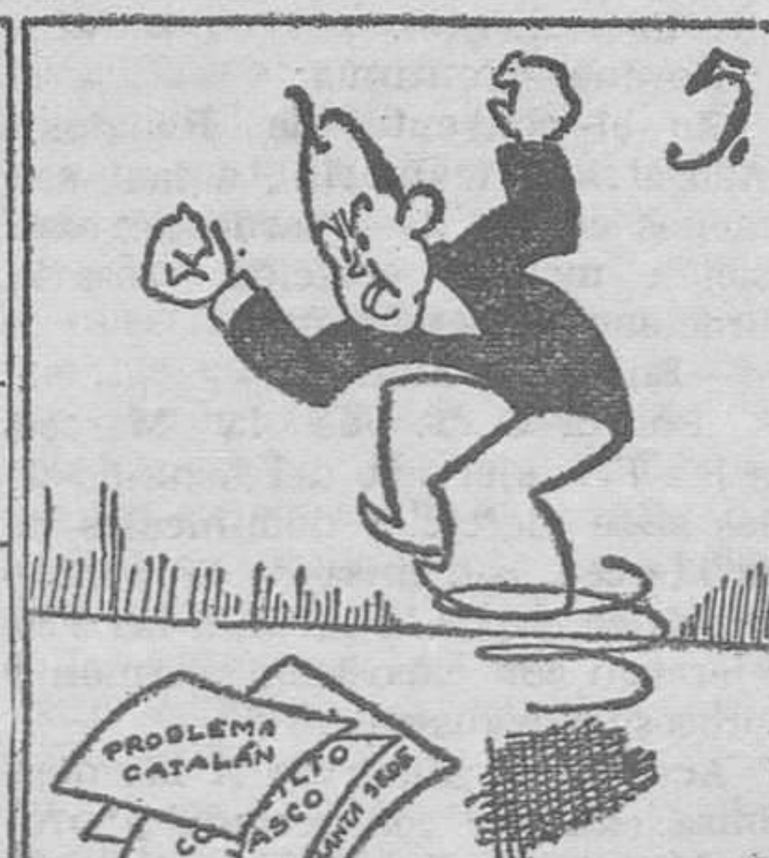
La C. E. D. A. tiene disgusto, y temen que dé algún susto.