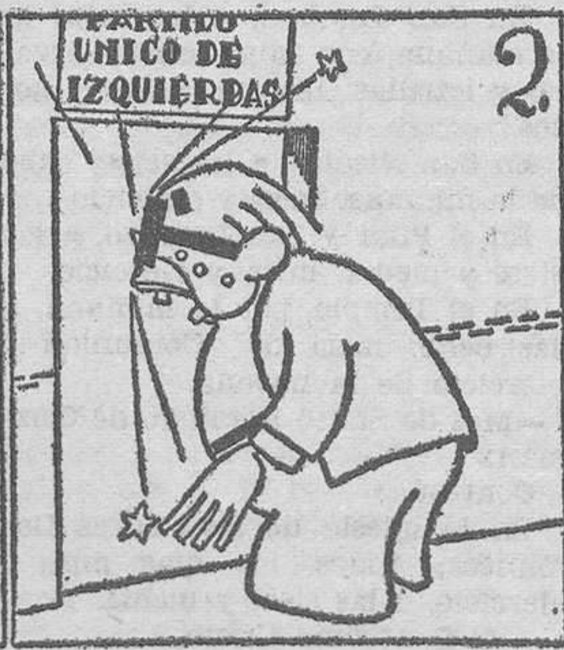
Le dan a Azaña (¡infeliz!) con la puerta en la nariz.