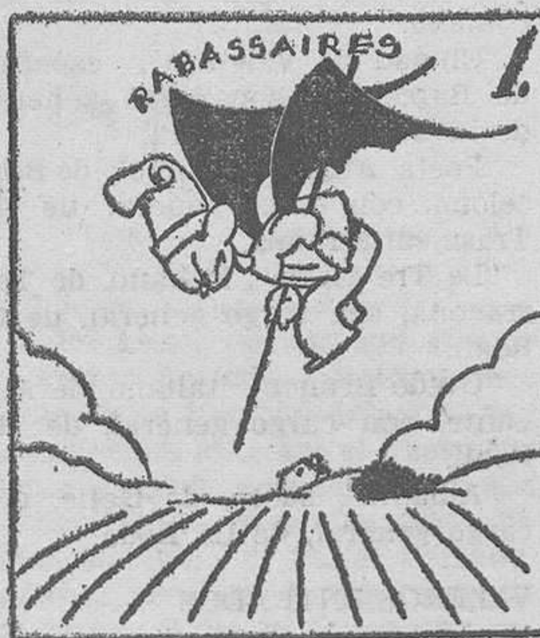
Cayó al campo, por los aires, la plaga de "rabassaires".