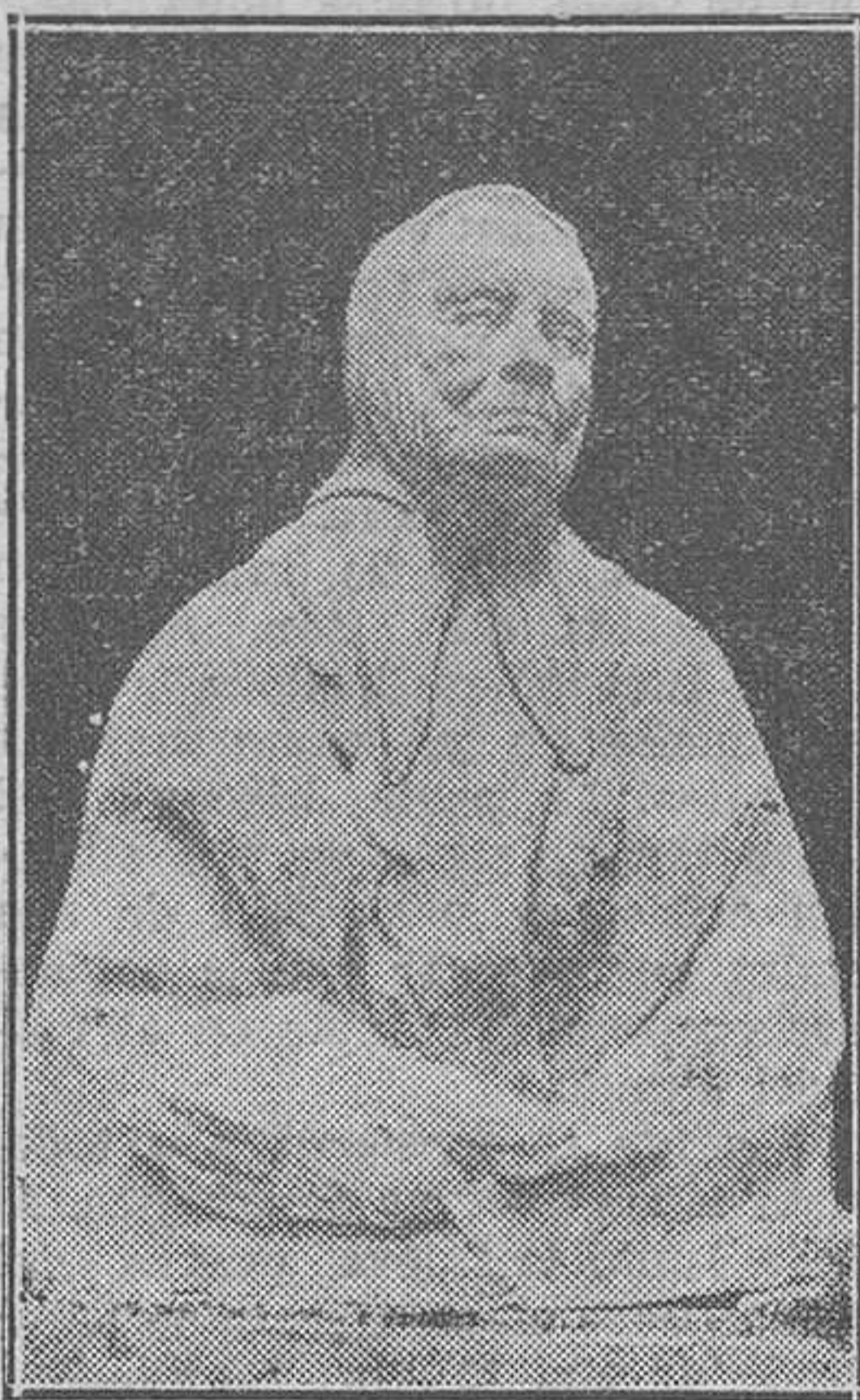
"Caridad", obra escultórica de Francisco Bolinches Mahiques, hijo de Játiva, y que mereció grandes elogios del público que visitó nuestra reciente Exposición de Bellas Artes

"...La metalurgia es activa, porque los propietarios de las minas de hierro de Bilbao, de Oviedo, de Pamplona, en su mayoría extranjeros... Las industrias mecánicas están todavía muy poco desarro-