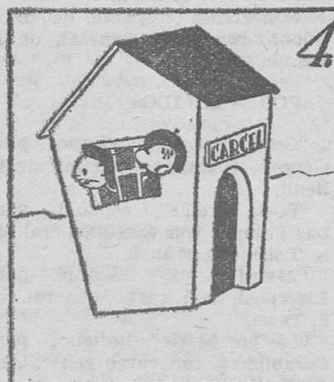
Pues trabajaron en balde, y en "Chirona" hay mucho alcalde.