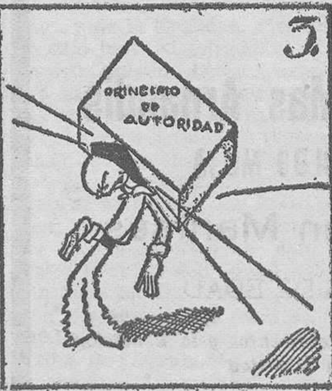
Euzkadi se queja y grita al golpe de esta "chinita".