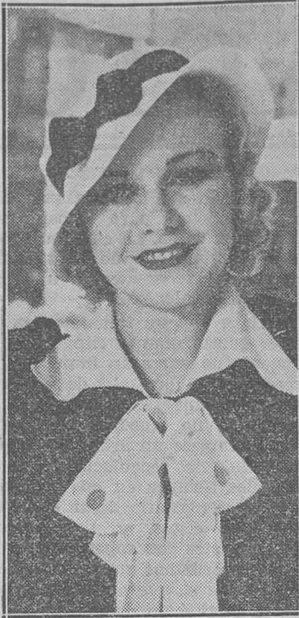
Ginger Rogers, que se destaca con- siderablemente como una fina ar- tista en la película musical de la Warner Bros. First National, "20 millones de enamoradas"

niserá", marcha española, Morató. 15: Cierre de la Estación. 18: Apertura de la Estación. Programa variado de discos. 19: Cierre de la Estación. 21: Apertura de la Estación. Re- transmisión del programa de Unión Radio Madrid. 22: Noticias de prensa. Conti- nuación de la retransmisión de Unión Radio Madrid. Selección de la zarzuela en un acto, original de los señores Arniches y Quintana, música del maestro Serrano, "La alegría del batallón". Noticias de última hora, servicio directo de Unión Radio Valencia. 23: Cierre de la Estación.