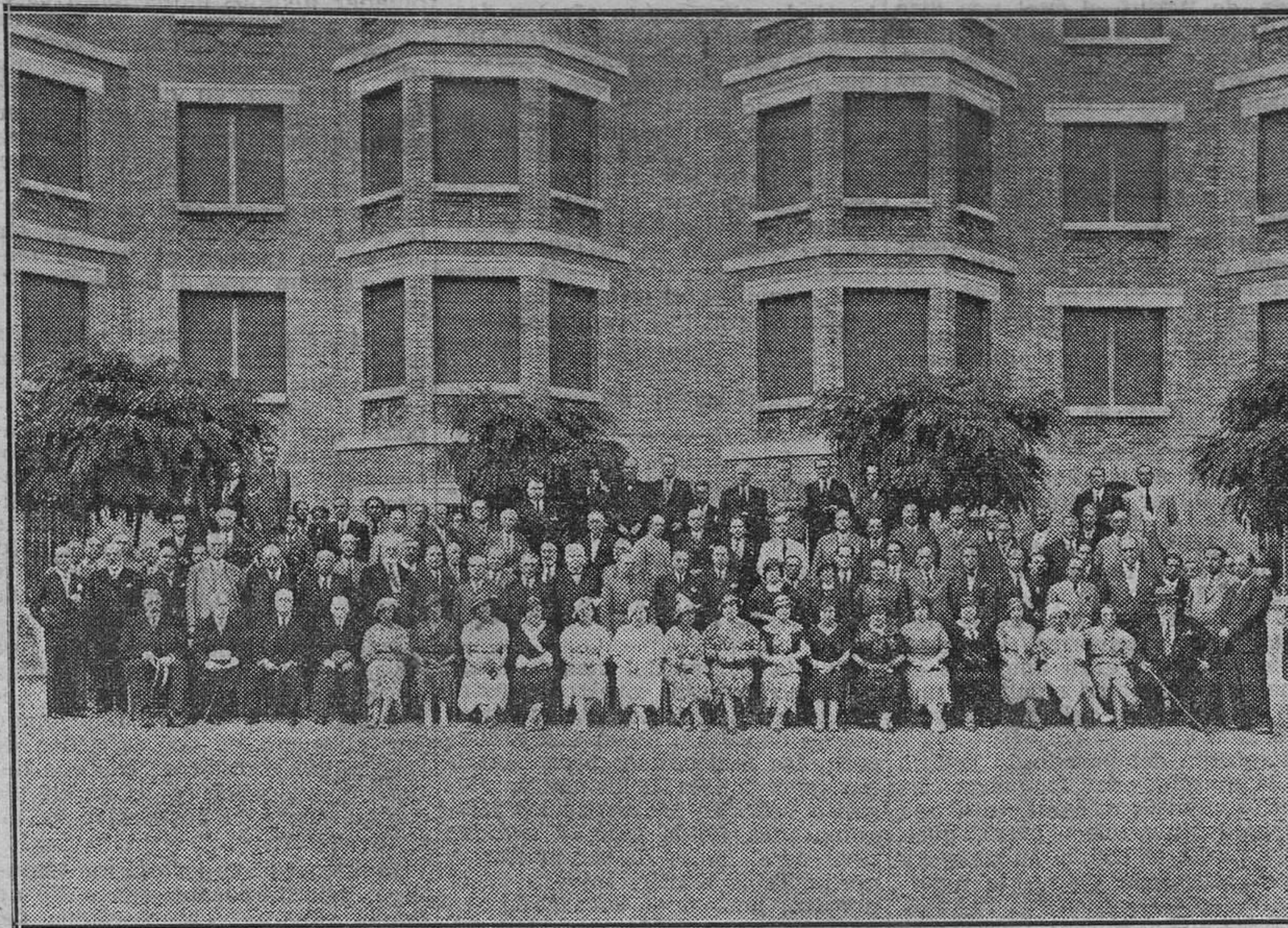
Asambleístas en su visita al grupo de casas baratas de la Caja de Previsión Social del Reino de Valencia.

pero el ejemplo debe advertir a los ilusos que, para que vean que en la alquimia del Estado no es oro todo lo que reluce y que el bienestar de un pueblo no viene siempre por los caminos que se busca. Y nada digamos el de una clase profesional.