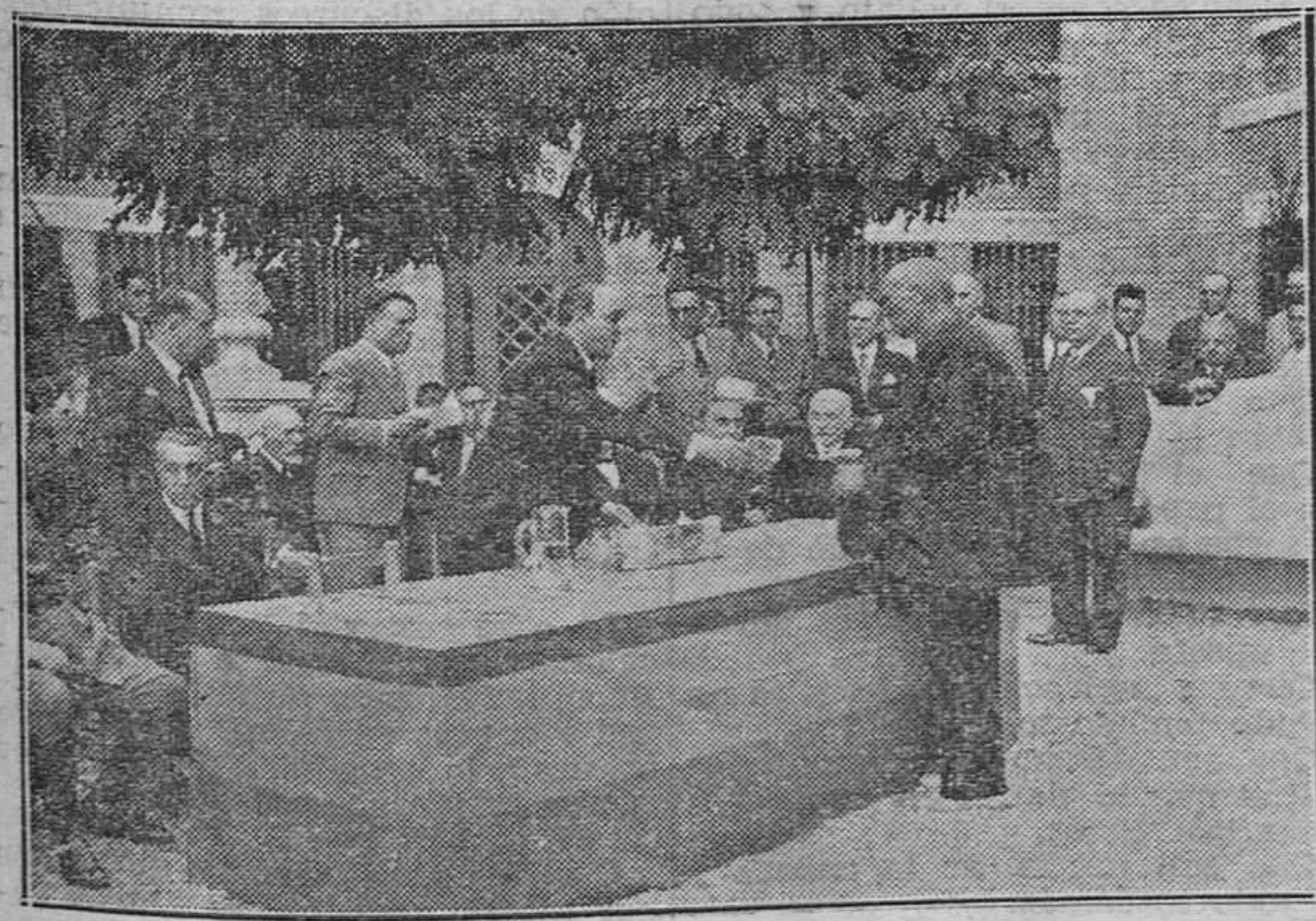
Primer reparto de 68.000 pesetas, realizado por la Caja de Previsión Social entre los ancianos que cumplieron 65 años durante la anualidad de 1933.