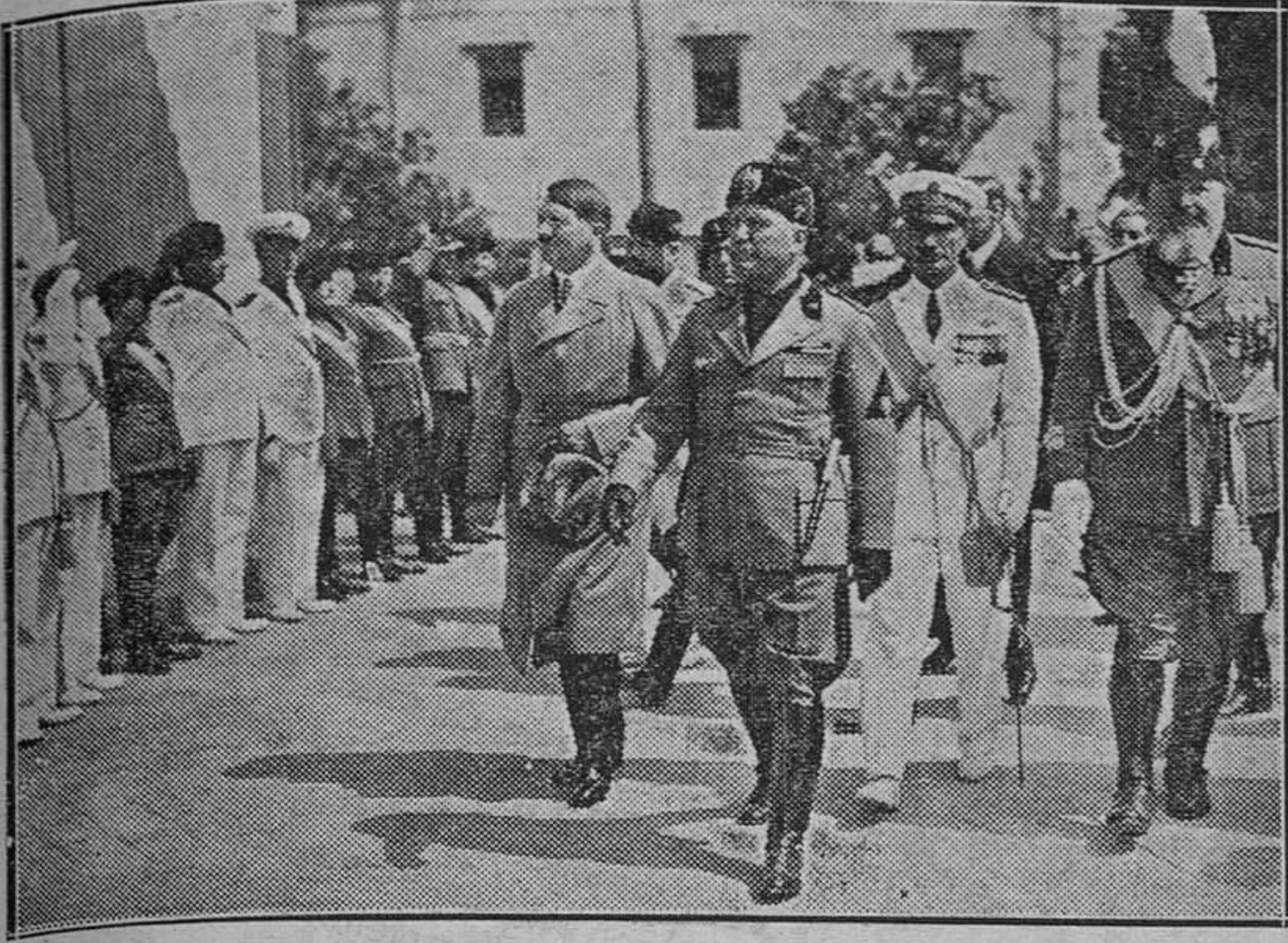
En Venecia. Hitler ha sido recibido por Mussolini.