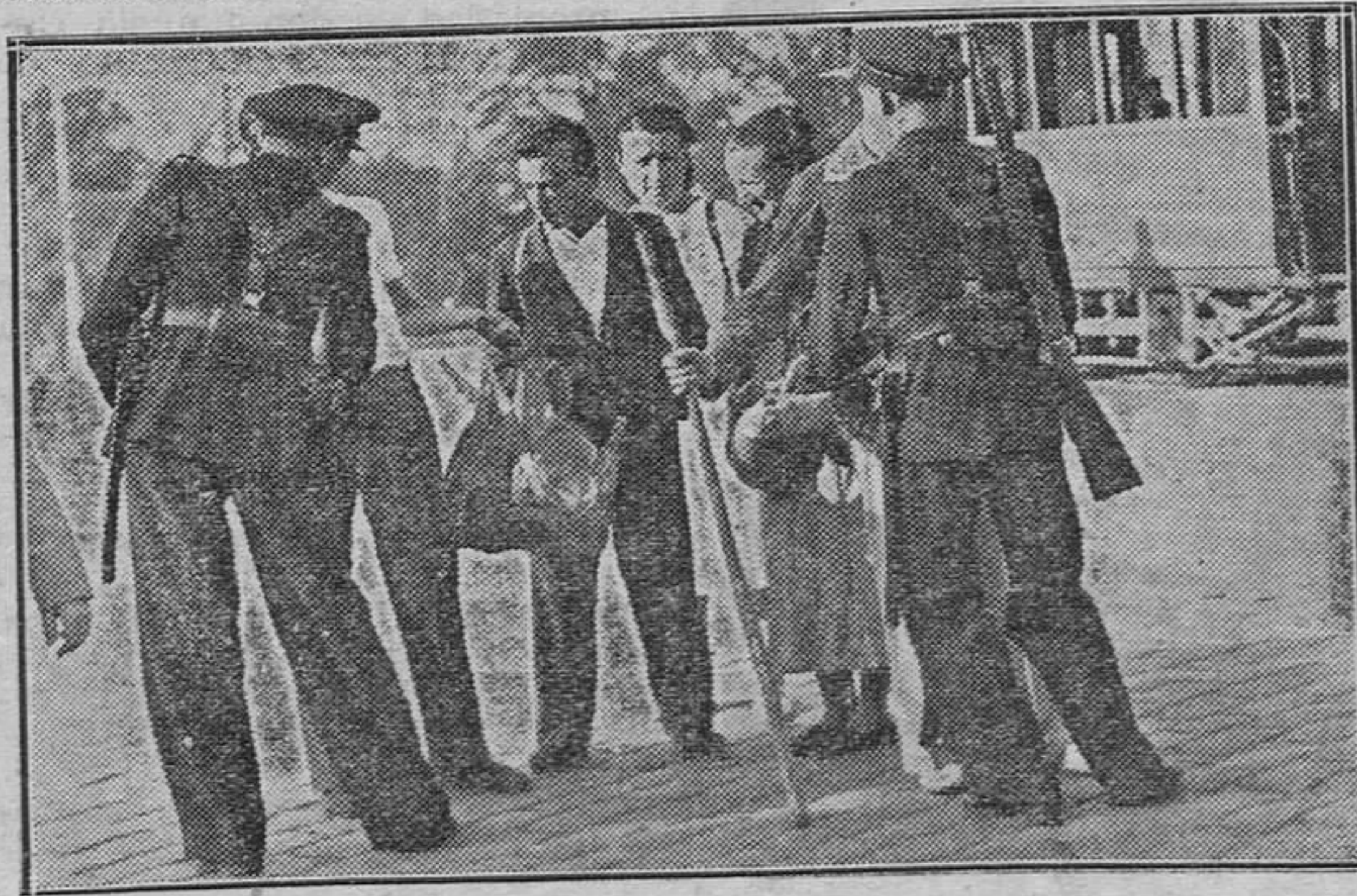
Registro en los alrededores de Madrid, de los excursionistas, el pasado domingo, en cumplimiento de órdenes de la superioridad.

Los médicos que le asisten y las escasas personas que han logrado ser recibidas por él, aseguran que se halla muy quebrantado físicamente.