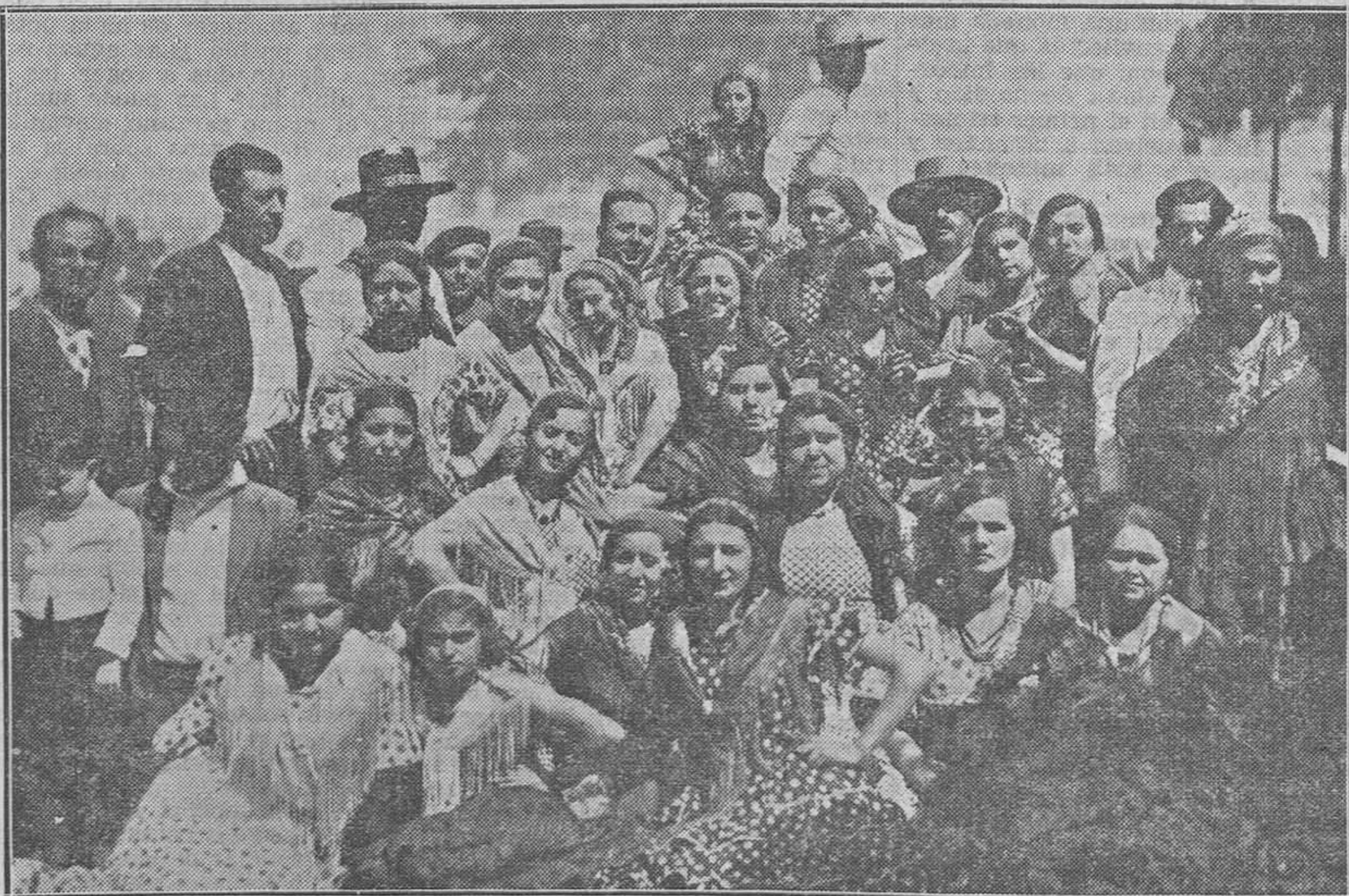
Grupo de romeros de la Hermandad de Almonte (Huelva).