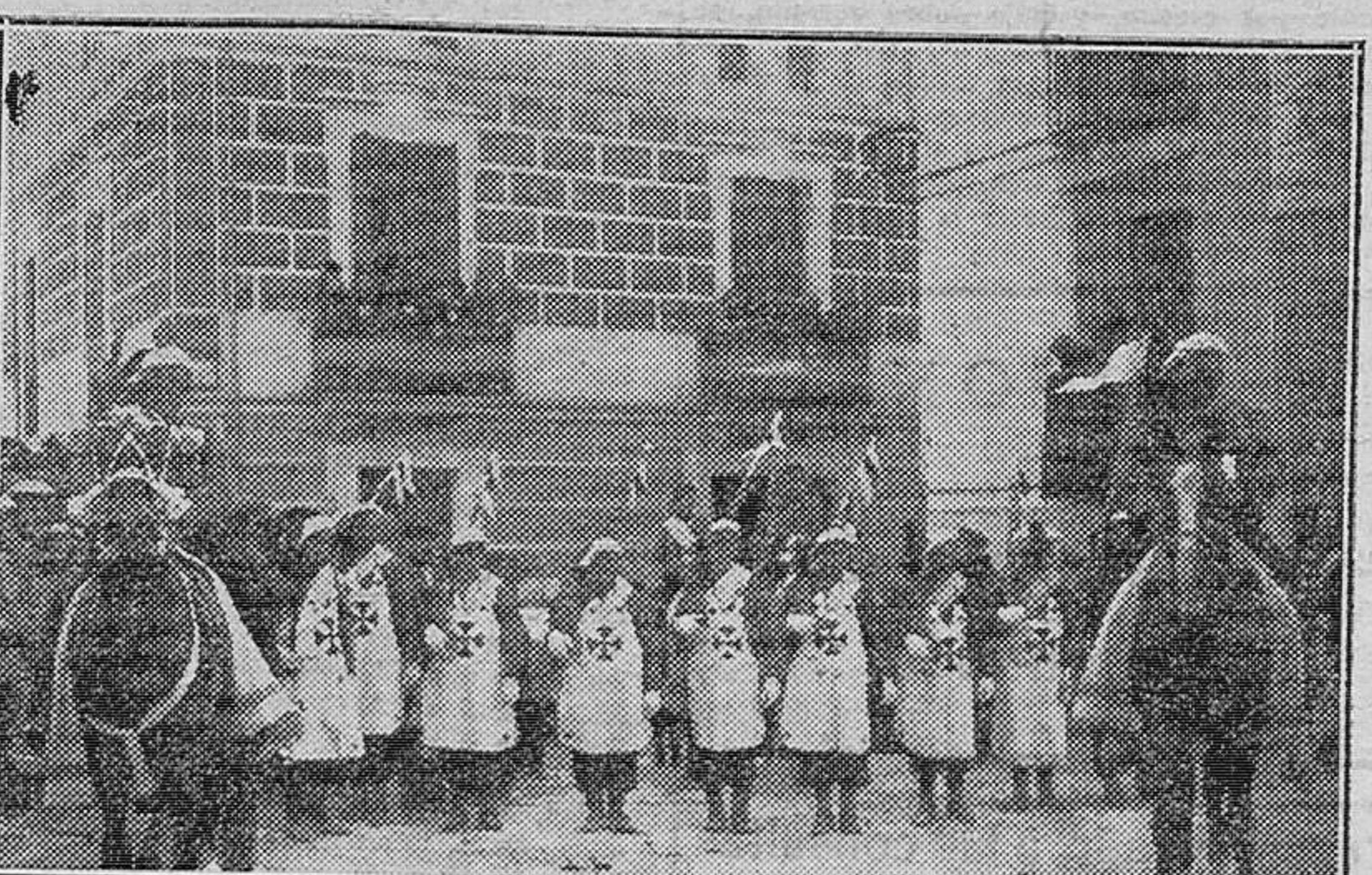
¡Tradición! Ello es realmente el poema de estas fiestas, donde junto al estallido de la pólvora, nace en miles de bocas el grito de ¡Viva San Blas, Patrón de Bocairente!

lor del más puro ideal de fe y patriotismo, al ver el simulacro de lo que pudo ser aquella no interrumpida lucha que principió en las agrestes montañas de Covadonga y terminó en las Alpujarras. Así, pues, los sentimientos religiosos y patrio parece se encumbren durante estas fiestas, y al mismo tiempo que las almas se extasian en los momentos más culminantes con que se festeja al glorioso Santo, al que todo el pueblo lo venera con devoción profunda, surten como compendio de tan arraigada fe voces que salen del pecho de todos los corazones con gran entusiasmo, repitiendo en el aire estas palabras: —¡Virca el Patrón San Blas! ¡Bocairente, mientras conserve su grandísima devoción a su Patrono y el entusiasmo a estas fiestas, será una villa de impercedero recuerdo! ALFONSO ESTEVE Maestro nacional y correspondiente de LAS PROVINCIAS