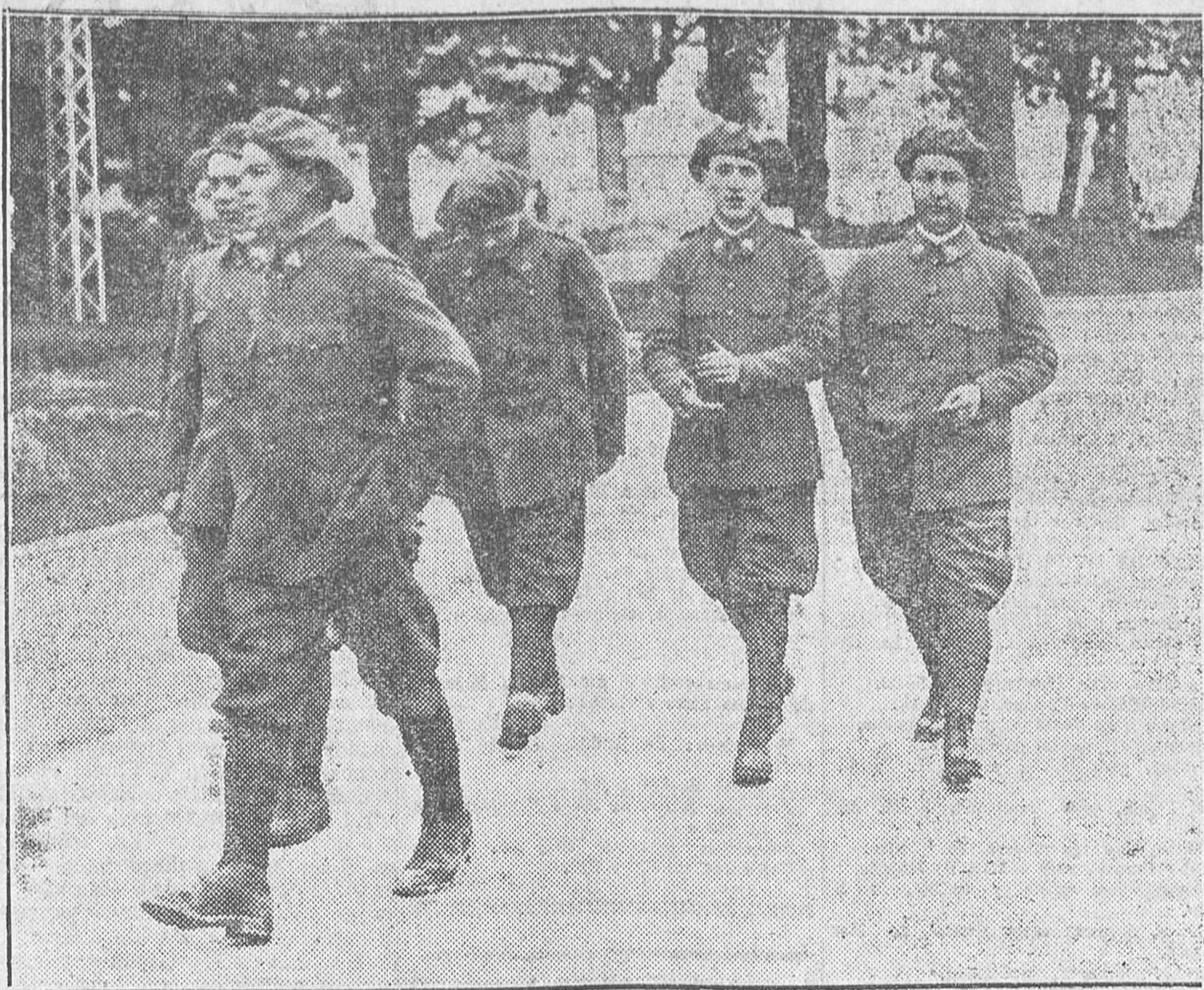
Un grupo de reclutas con el nuevo uniforme