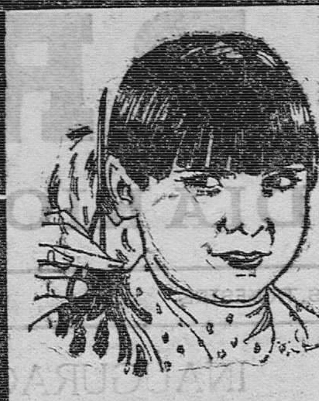
Completarán programa.—Estreno: NOTICARIO FOX.—Estreno: ESPOSAS MAL COMPRENDIDAS; por Betty Compson y Adolfo Menjou.—Estreno: LA GATA CONVERTIDA EN MUJER, dibujos animados; y estreno de una cómica en 2 partes