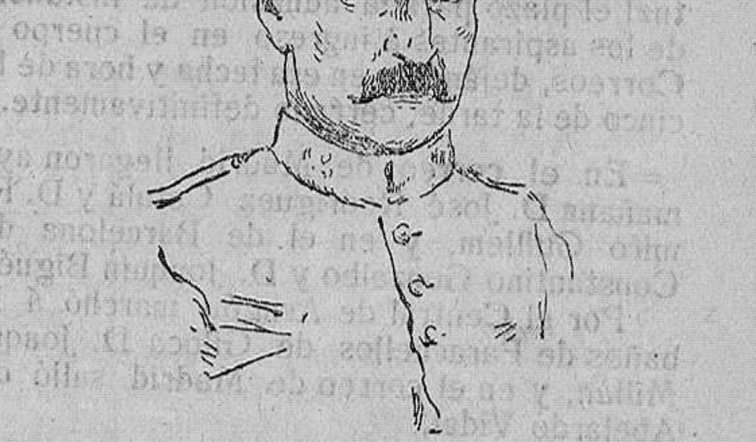
D. IGNACIO AXÓ Coronel del regimiento de infantería de Africa, propuesto para el ascenso por méritos de guerra.

Esta noche, á las once, fuegos aéreos en la Gran Pista por el pitonético Sr. Tortosa, de Benimámet.