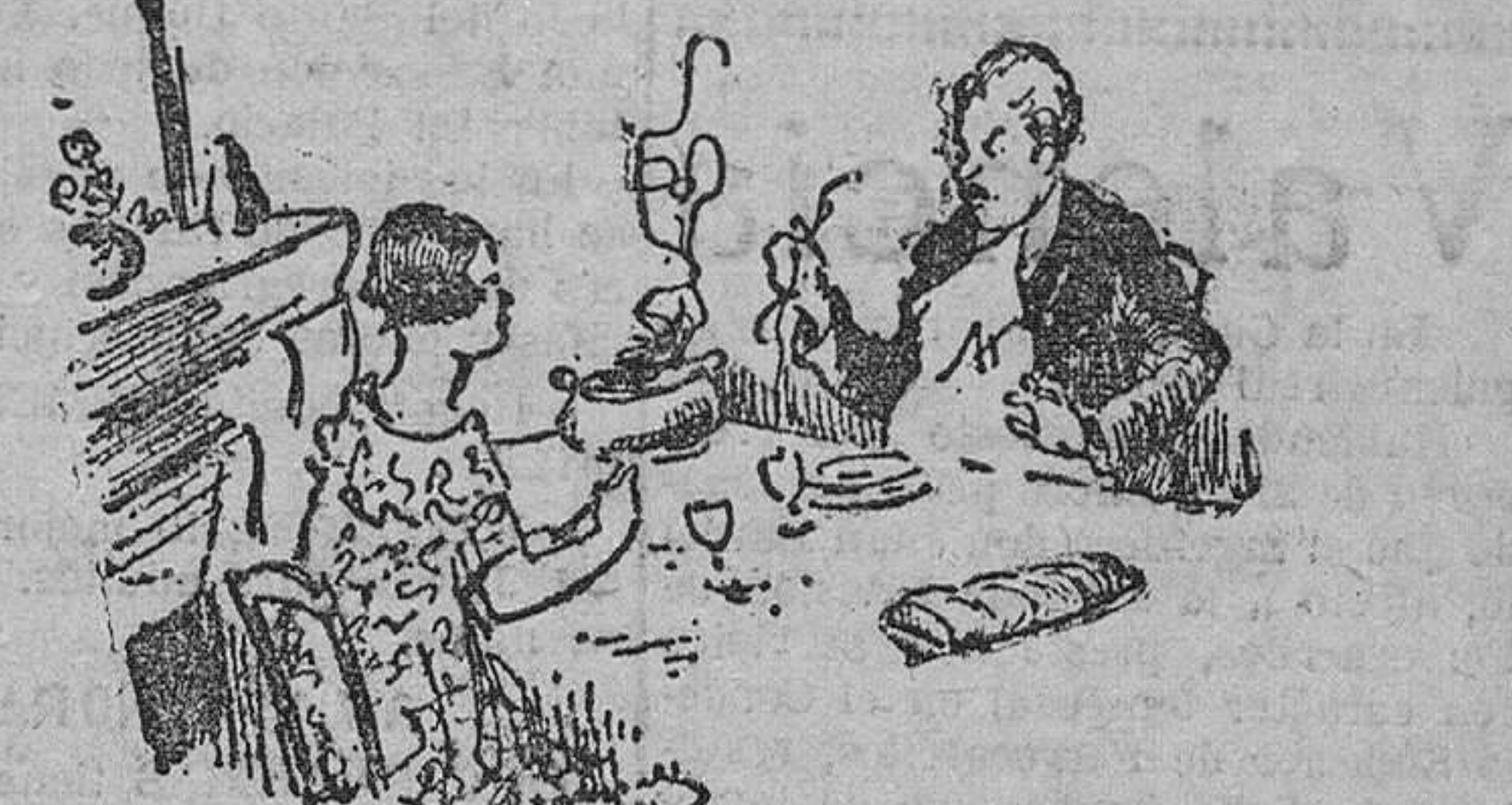
El.—Caramba, otro cabello en la sopa... Ella.—Pero esta vez es uno de los tuyos... Fíjate bien, que es largo.