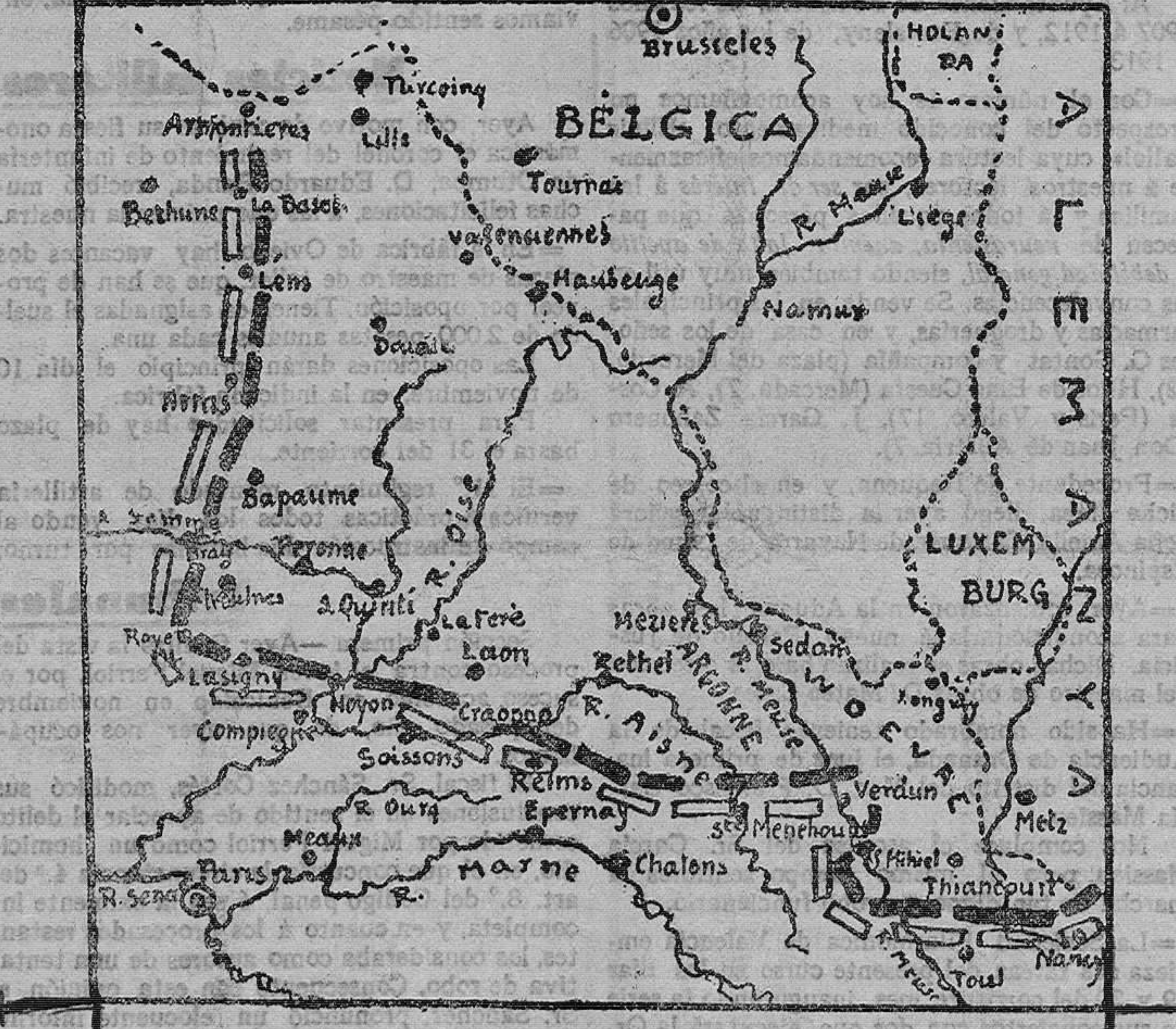
Situación actual de los ejércitos

De resultas de haber entrado nuevos contingentes alemanes procedentes de Bélgica por Turcoing y Lille, la línea de batalla se ha alargado desmesuradamente.