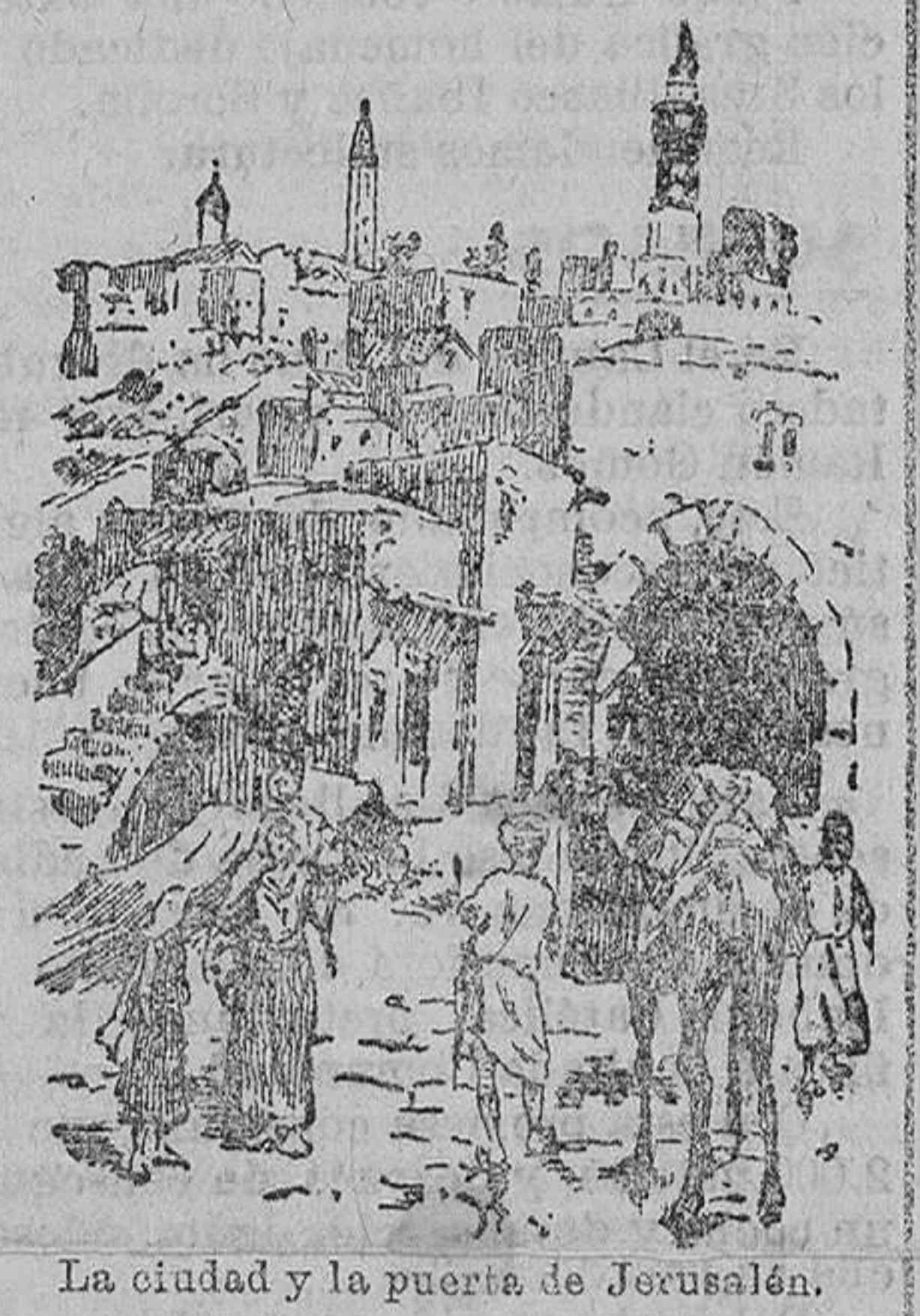
La ciudad y la puerta de Jerusalén

Penetrando en la ciudad por la puerta de Jerusalén, nos encontramos con una calle estrecha y tortuosa, que corta a Betlehem en casi toda su longitud.