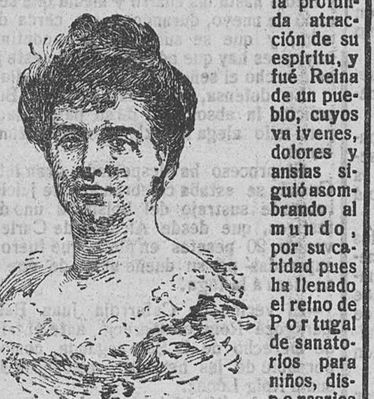
La Reina doña Amélia

El competente coronel dió, para su resolución, el siguiente: Combate de una vanguardia contra un enemigo que defiende una posición fortificada.