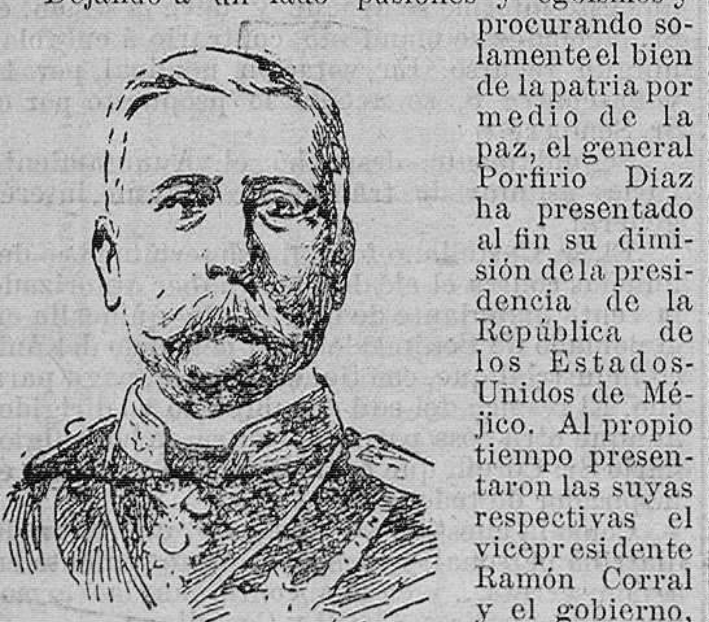
General Porfirio Díaz

Abre la sesión el Sr. Montero Ríos, y sin debate se aprueba el proyecto de caminos vecinales. Se reanuda el debate sobre proyecto de supresión de los consumos. Rectifica el Sr. Sánchez de Toca, quien asegura que carece el gobierno de derecho para obligar á amigos y enemigos á que voten contra los dictados de su conciencia. «La energía no debe emplearla el señor de borregos. El Sr. Canalejas se encuentra en la misma situación que el Sr. Moret en el día de Miércoles de Ceniza de hace dos años.»