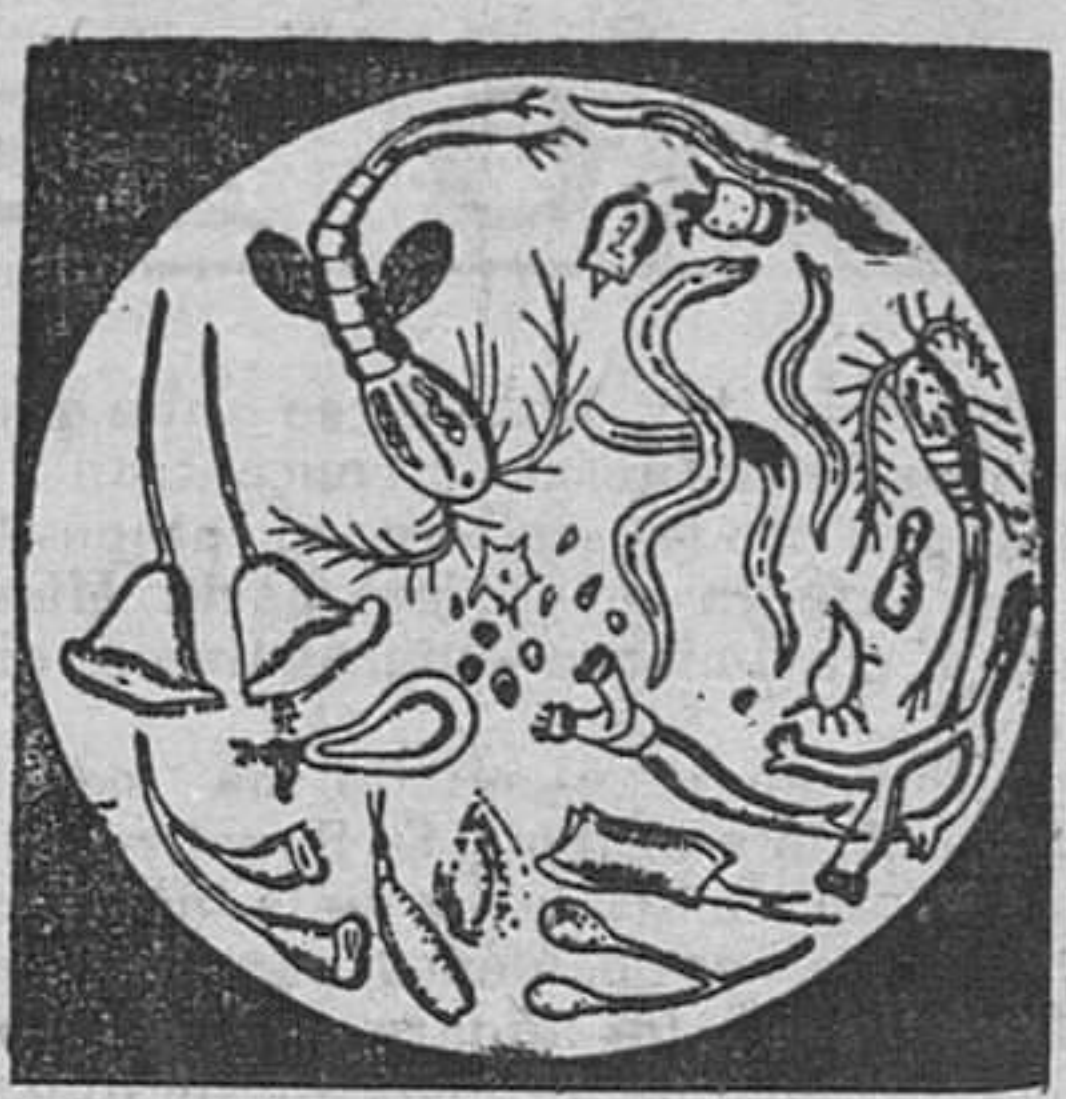
MICROBIOS destruidos por el Alquitran-Guyot

Pomares, 15 de febrero 1910.—Muy señor mío: Tengo la mayor satisfacción en darle las gracias por su excelente Alquitran-Guyot, del cual he comprado un frasco, que inmediatamente he empezado á usar. El resultado no se ha hecho esperar, y á los ocho días ya desde algunos años de una tosa seca, que creía ser crónica; á los ocho días está radicalmente curado.—Firmado: Henri X., Pomar z (Landi).