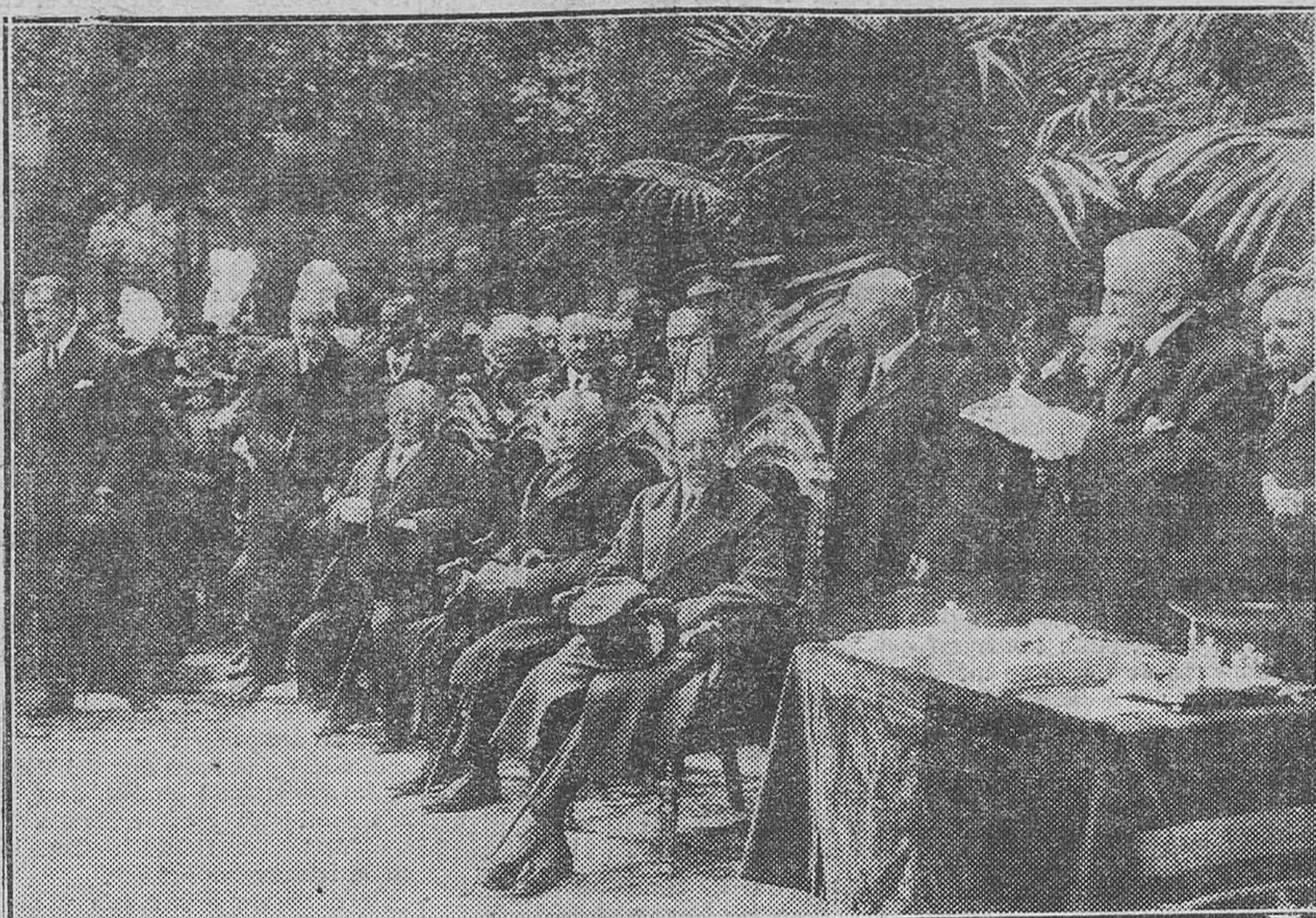
El conde Gimeno pronunciando su discurso ante el Rey y el Gobierno