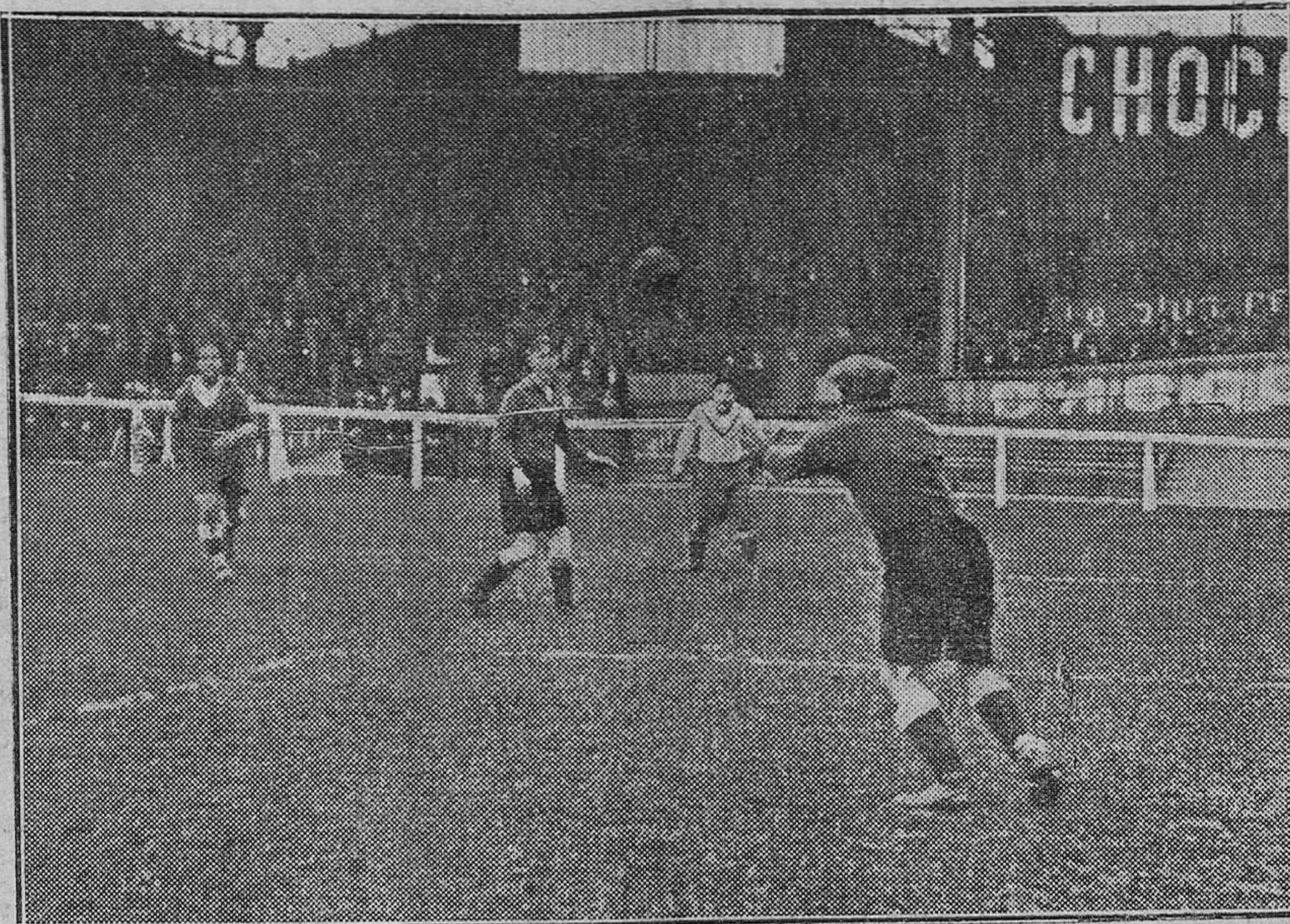
Paris.—En el Stadium Buffalo: Un momento de apuro en la portería francesa, en el encuentro Red Star-Europa, del pasado domingo.