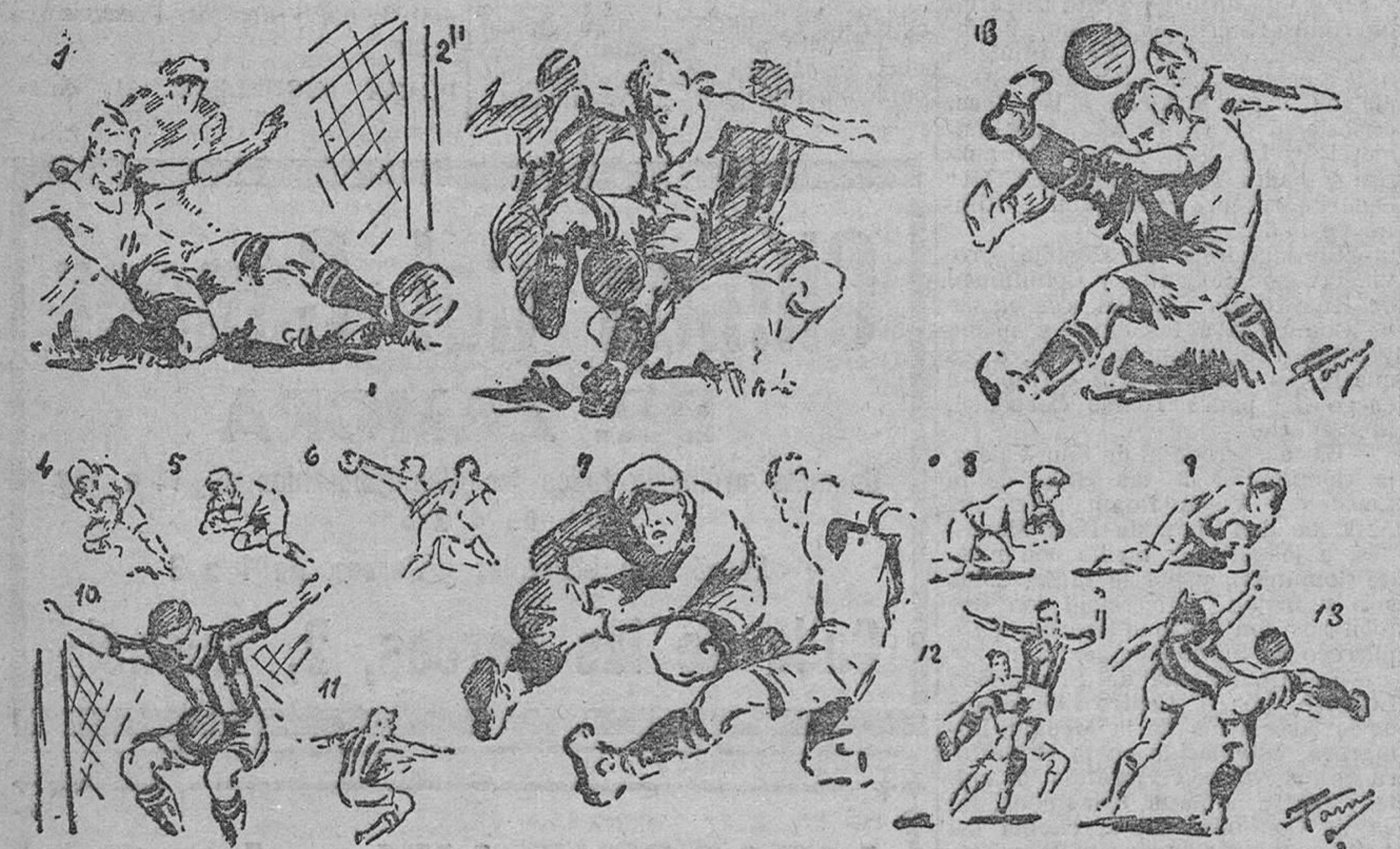
Apuntes gráficos del encuentro Castellón-Valencia, por Tormo

CRUZ BLANCA Plaza Mariano Benlliure, 5. SI EL NIÑO sufre diarreas, babeos, o tiene una DENTICION difícil sálvelo con PANACEA CORELL