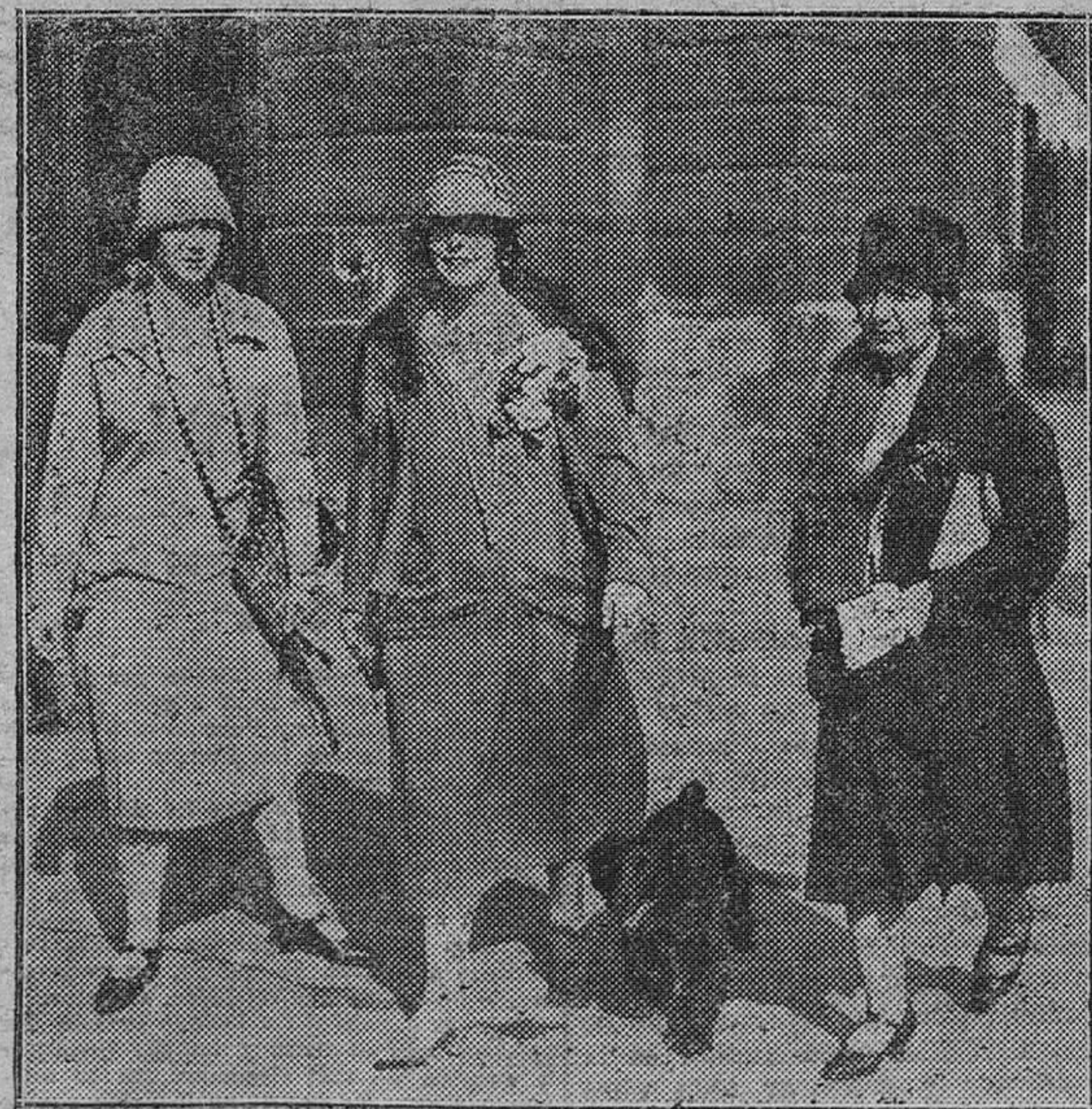
La Reina de Rumania con su hija, acompañadas de una dama de honor, en la playa de Vendome (Paris), adonde llegaron el lunes