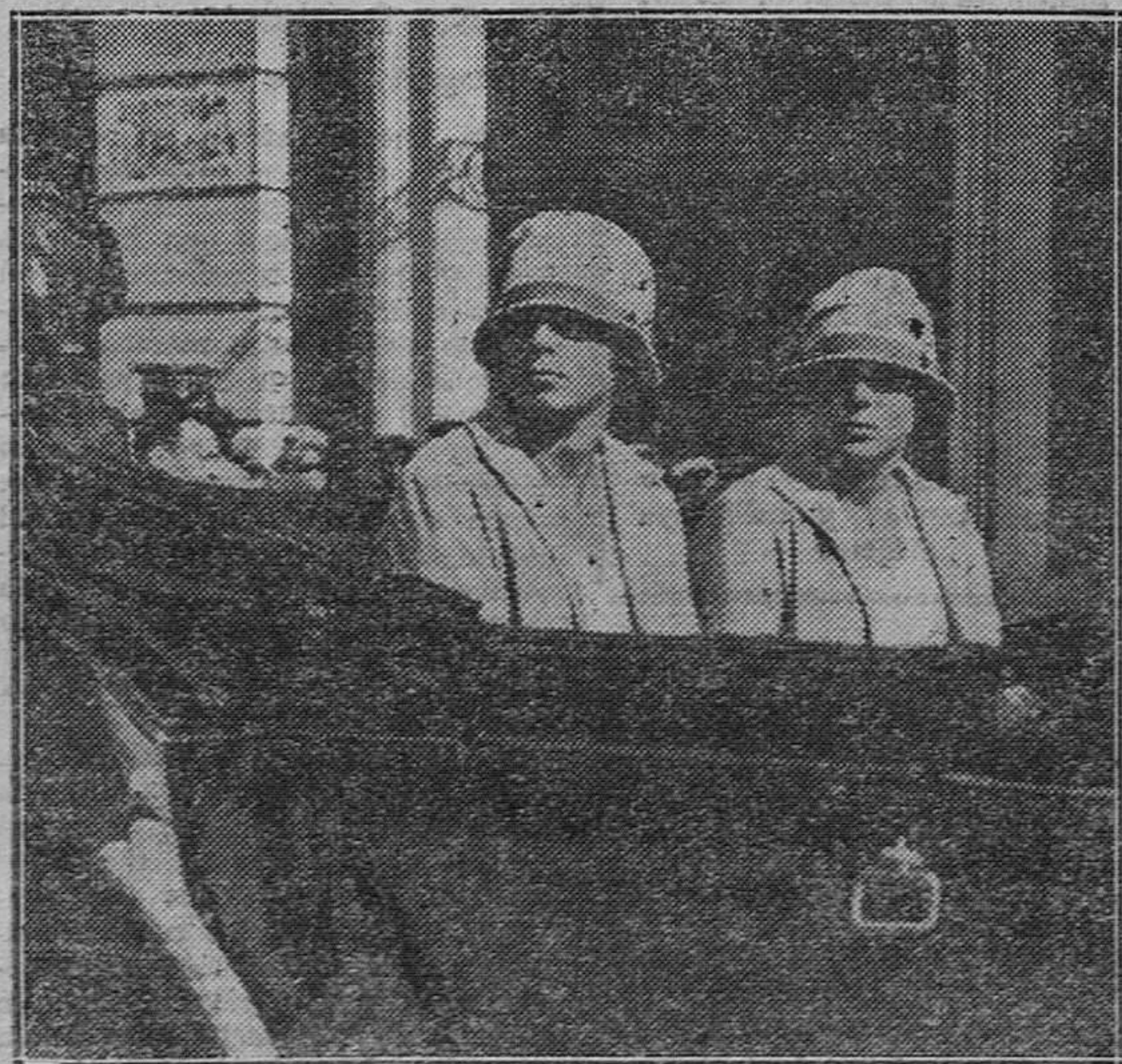
Las infantitas doña Beatriz y doña Cristina, al salir de la estación del Norte, a su llegada a Madrid