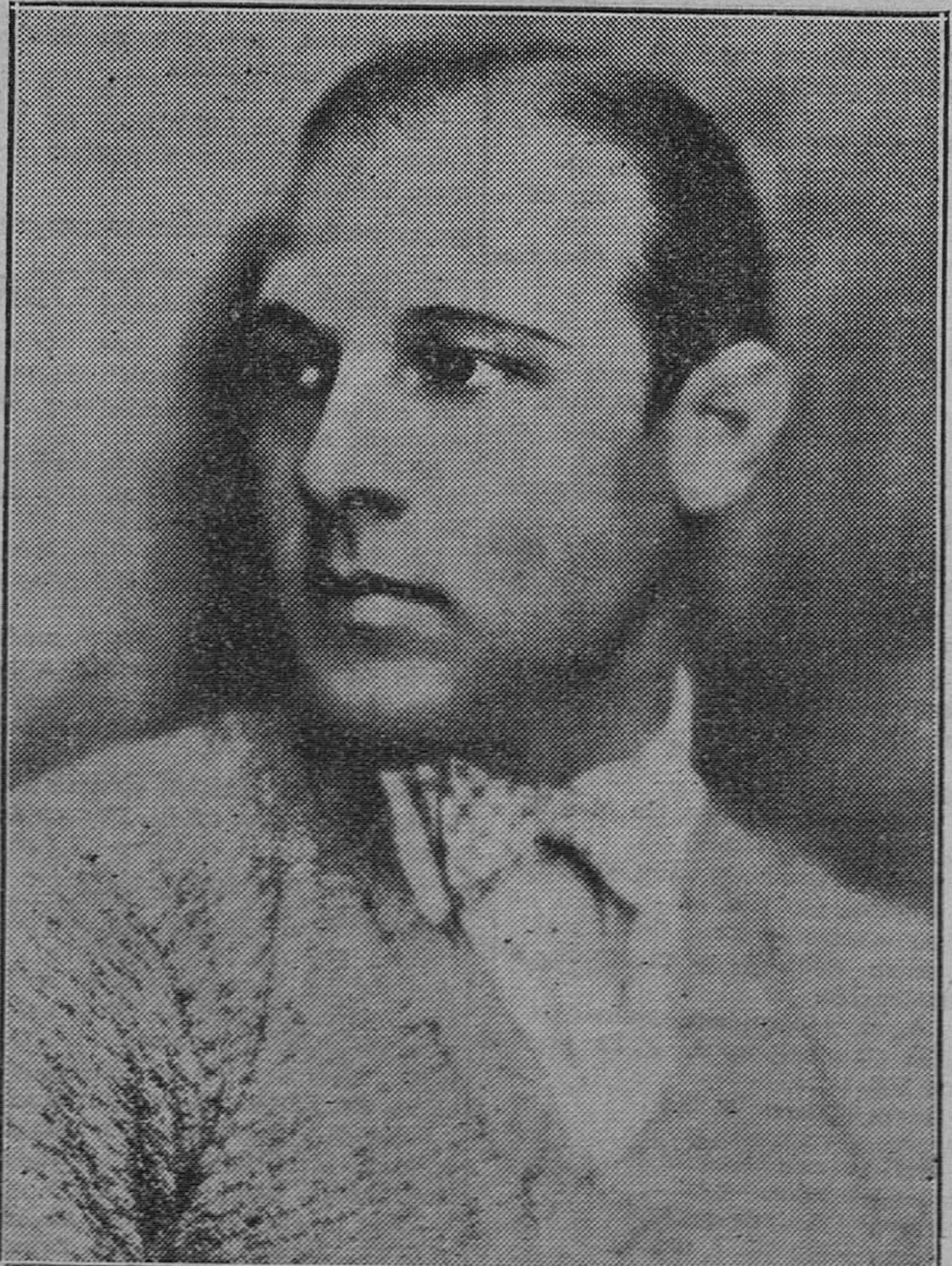
Ultima fotografia del malogrado Rodolfo Valentino, después de haber impresionado la superproducción para «Artistas Unidos», titulada «El grumete del velero».

LUNES PROXIMO: Los niños del Hospicio Producción regional