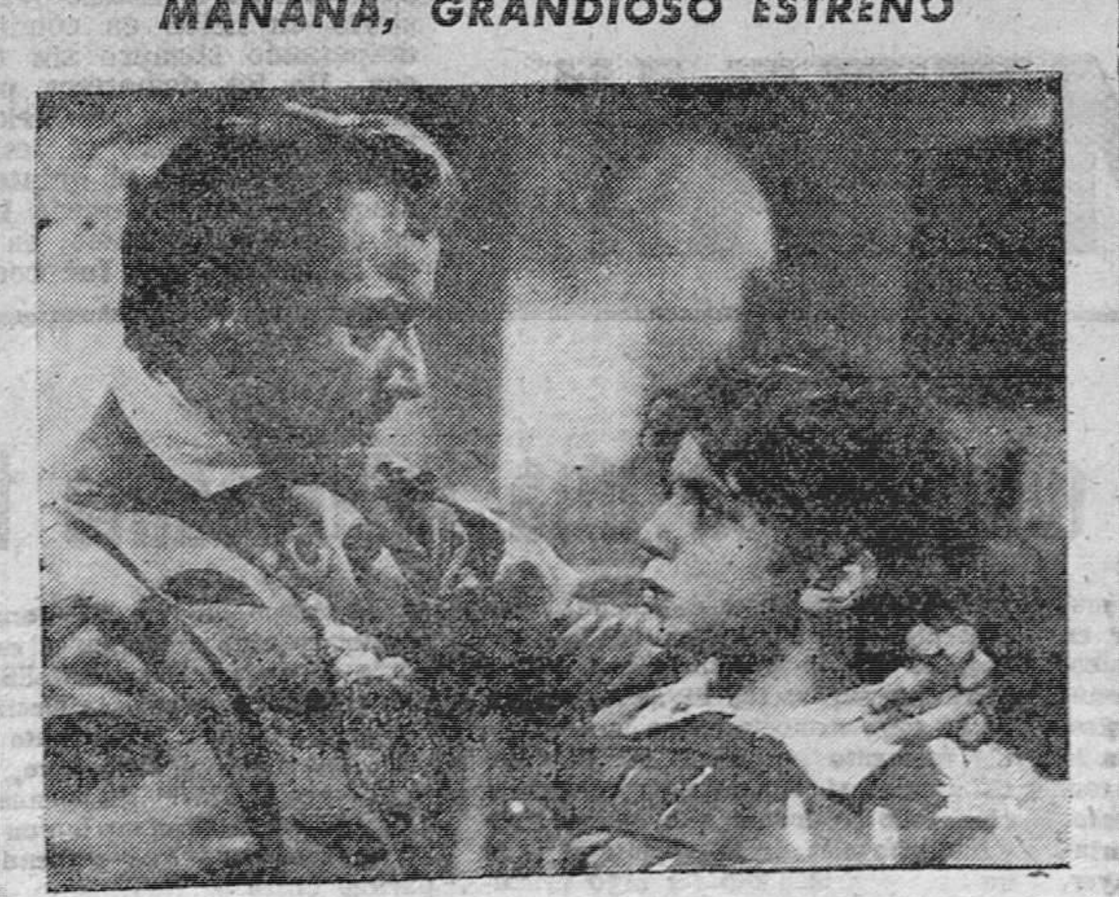
La infancia de uno de los más gigantes personajes de nuestra Historia. Un gran film, portador de valores hutescos personajes de nuestra historia. (NIÑEZ DE DON JUAN DE AUSTRIA) MANDE RESERVAR SU LOCALIDAD CON ANTICIPACION

Un acontecimiento cinematográfico. Una grandiosa superproducción nacional. MAÑANA, GRANDIOSO ESTRENO