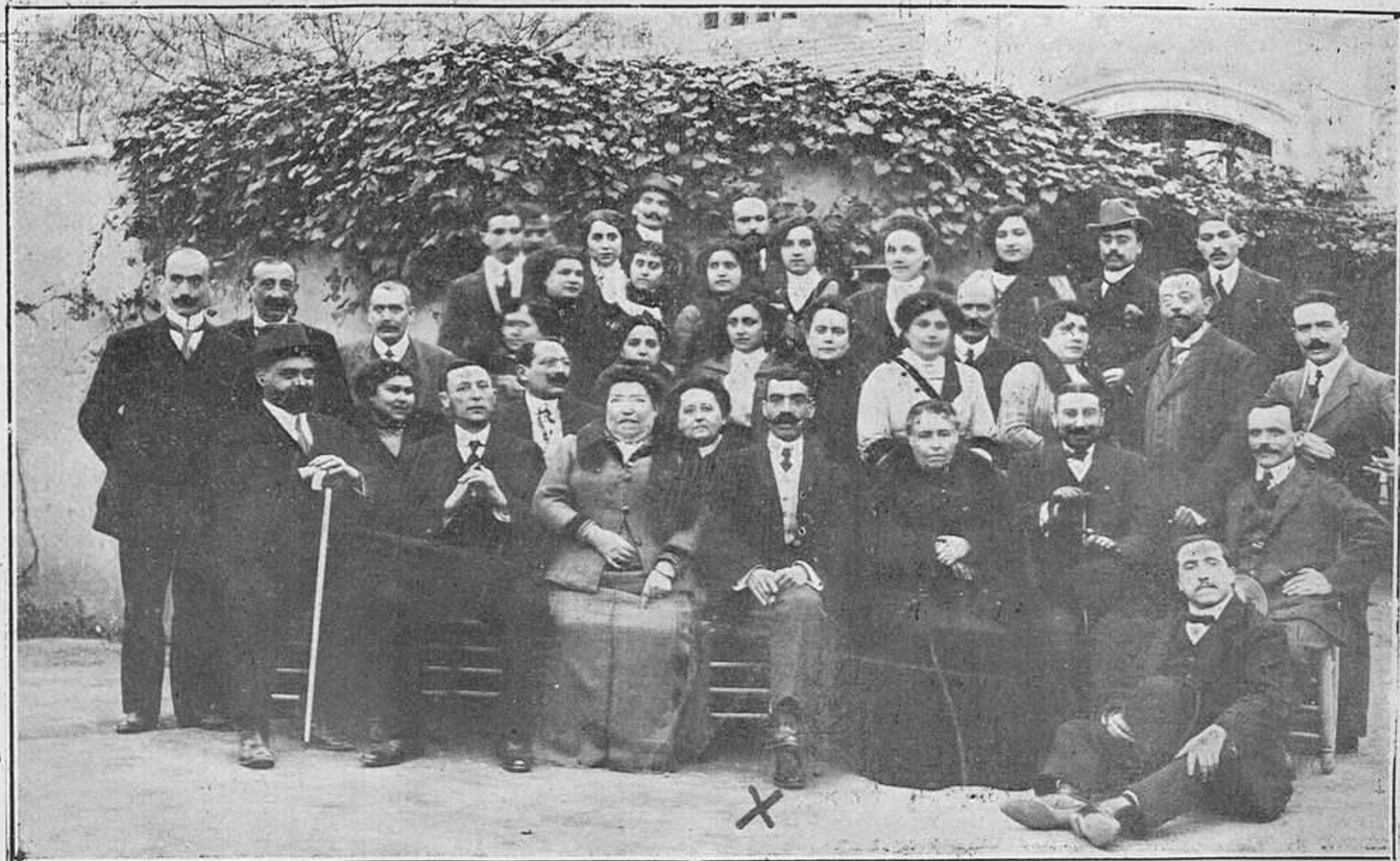
Grupo de Maestros con el Delegado Regio (x)