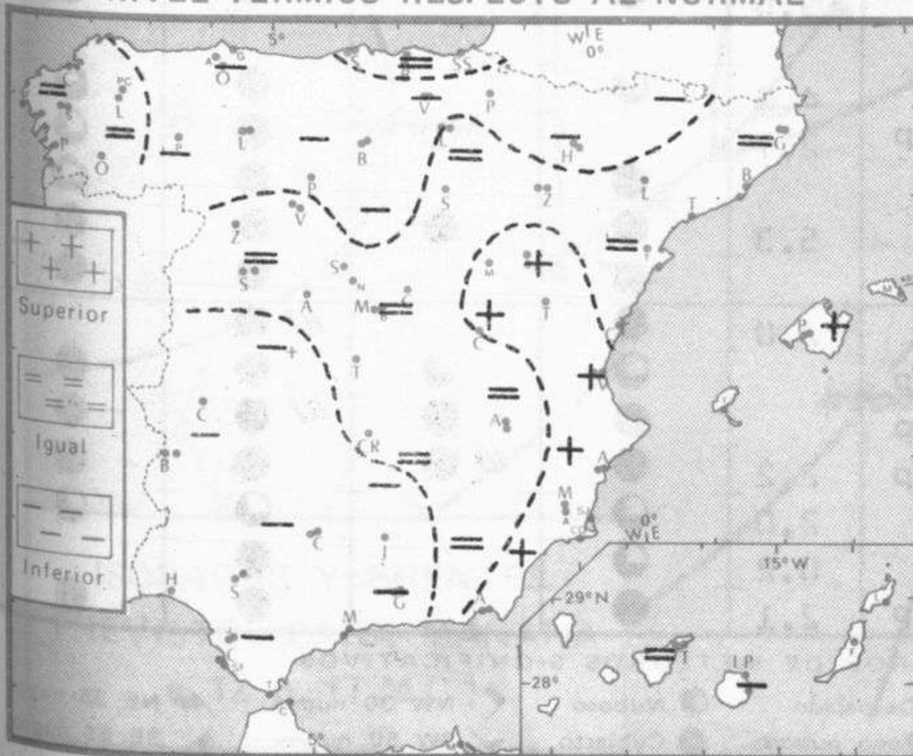
NIVEL TERMICO RESPECTO AL NORMAL