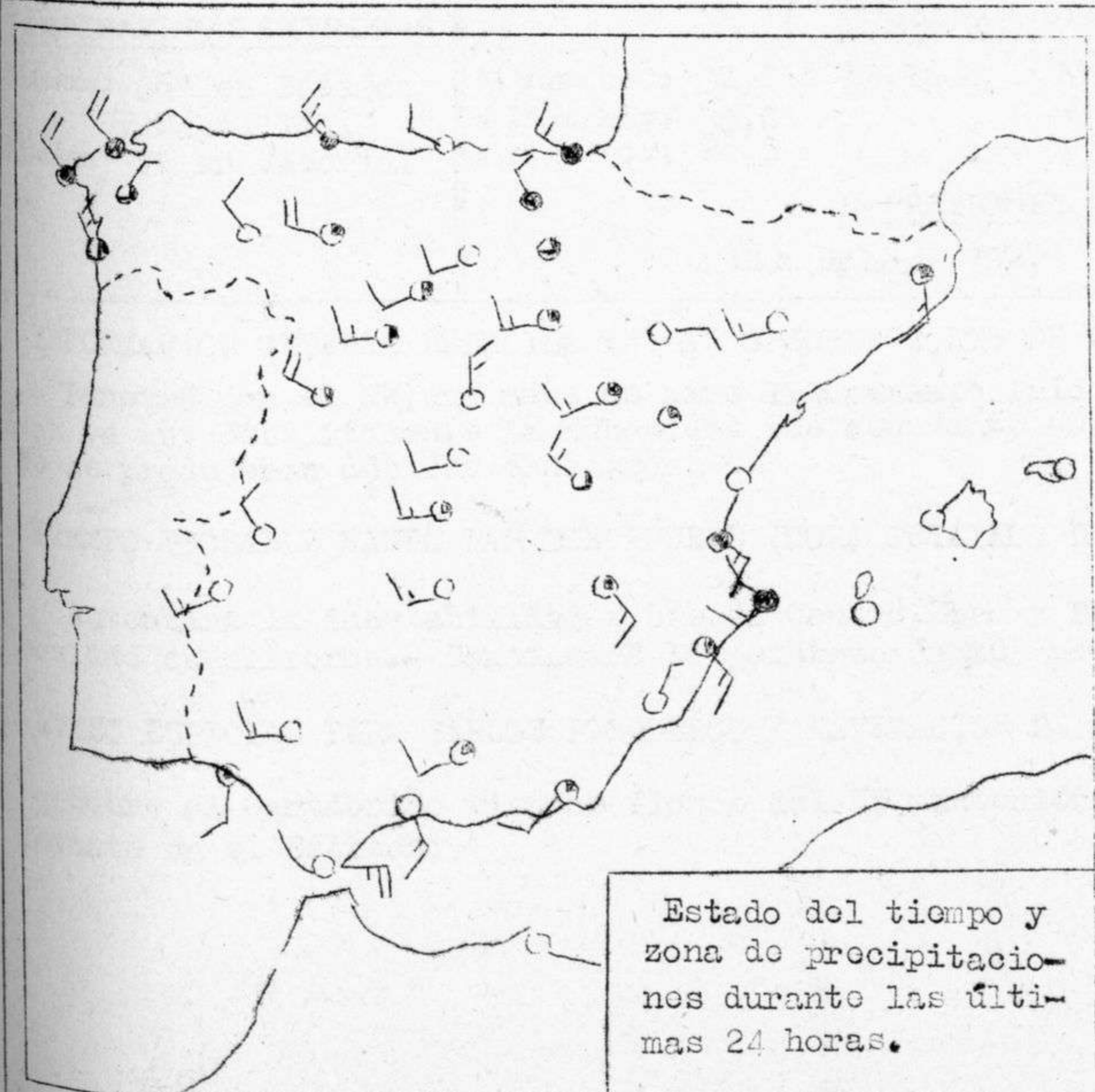
Estado del tiempo y zona de precipitaciones durante las últimas 24 horas.