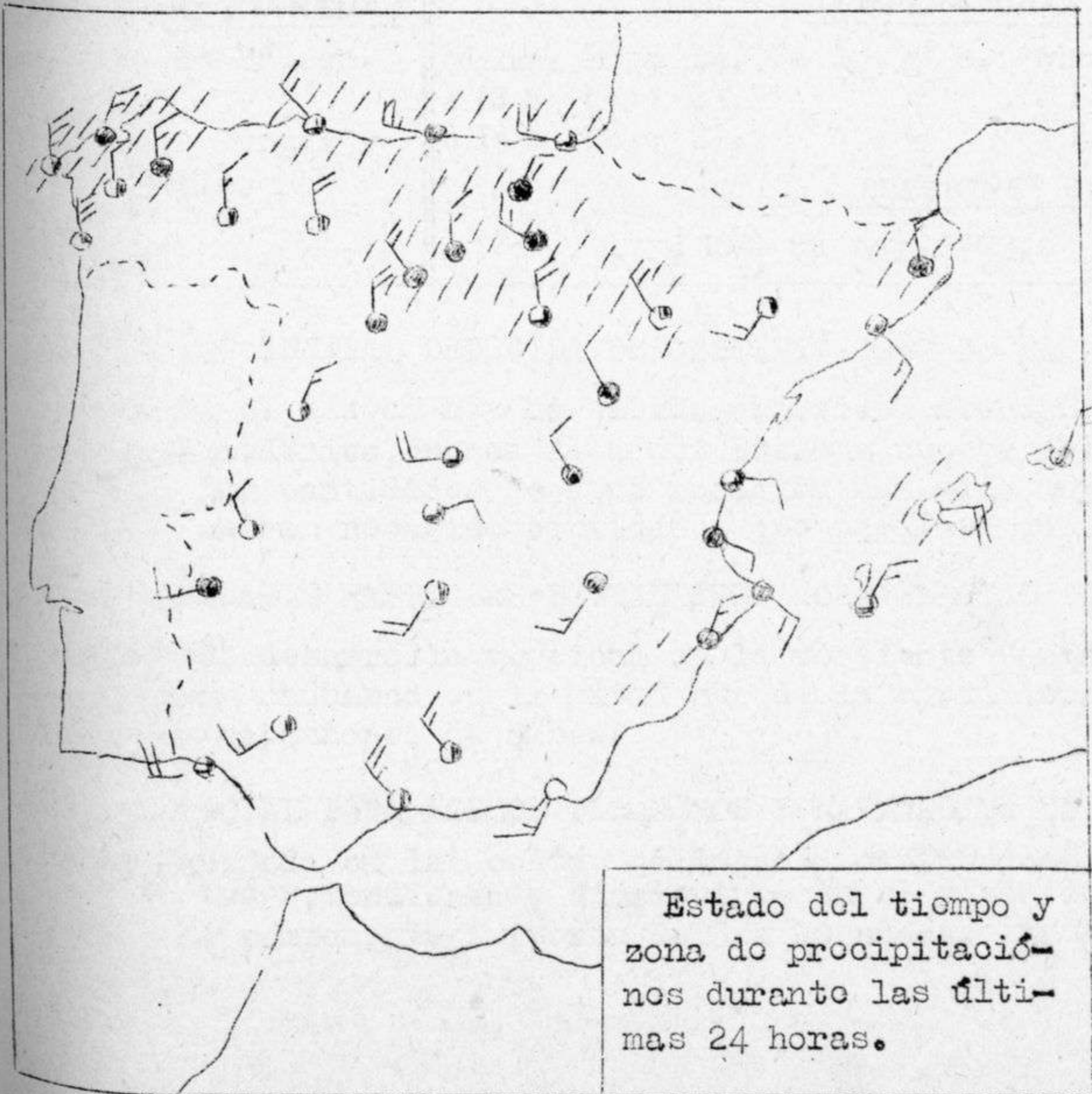
Estado del tiempo y zona de precipitaciones durante las últimas 24 horas.