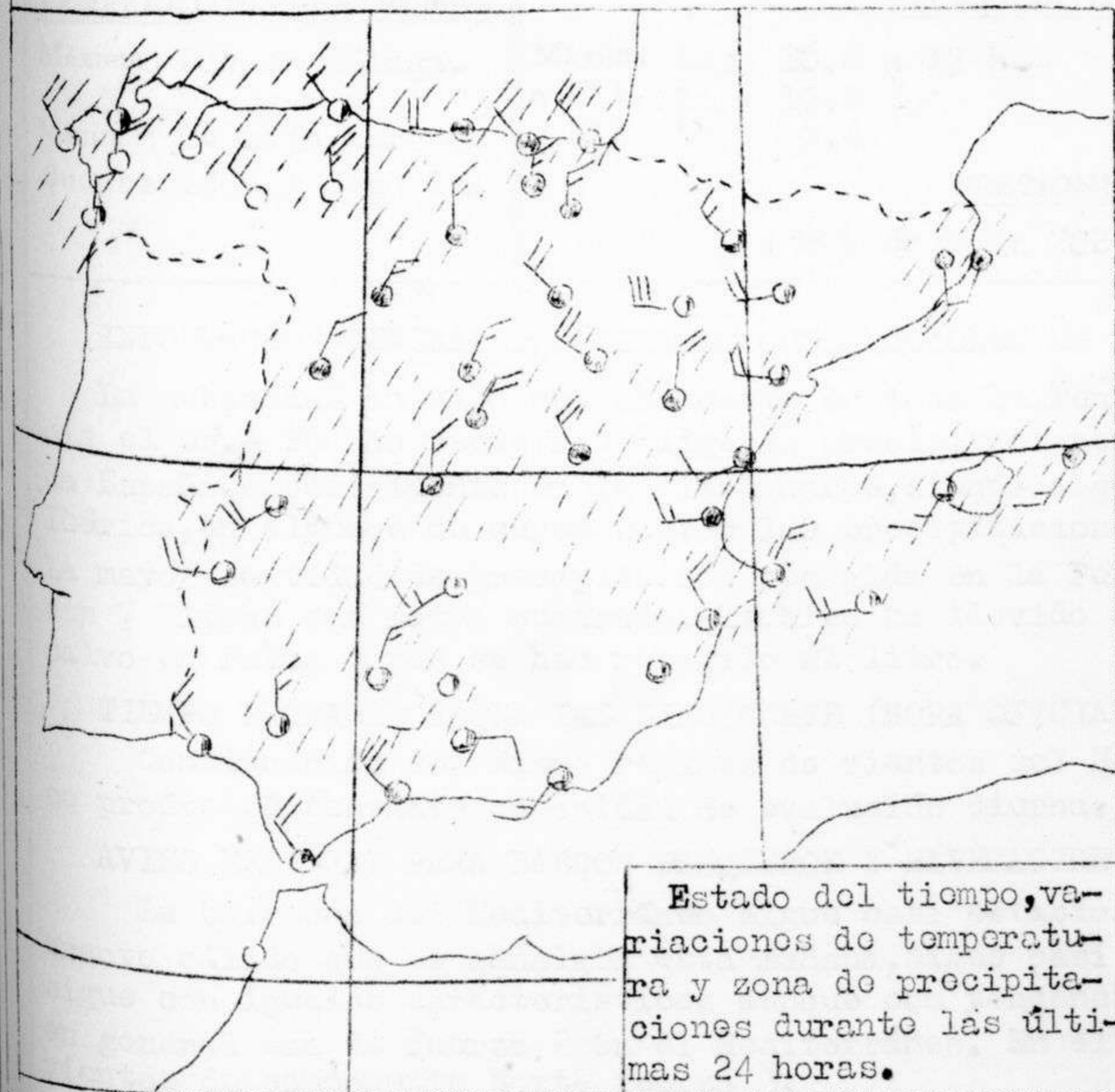
Estado del tiempo, variaciones de temperatura y zona de precipitaciones durante las últimas 24 horas.