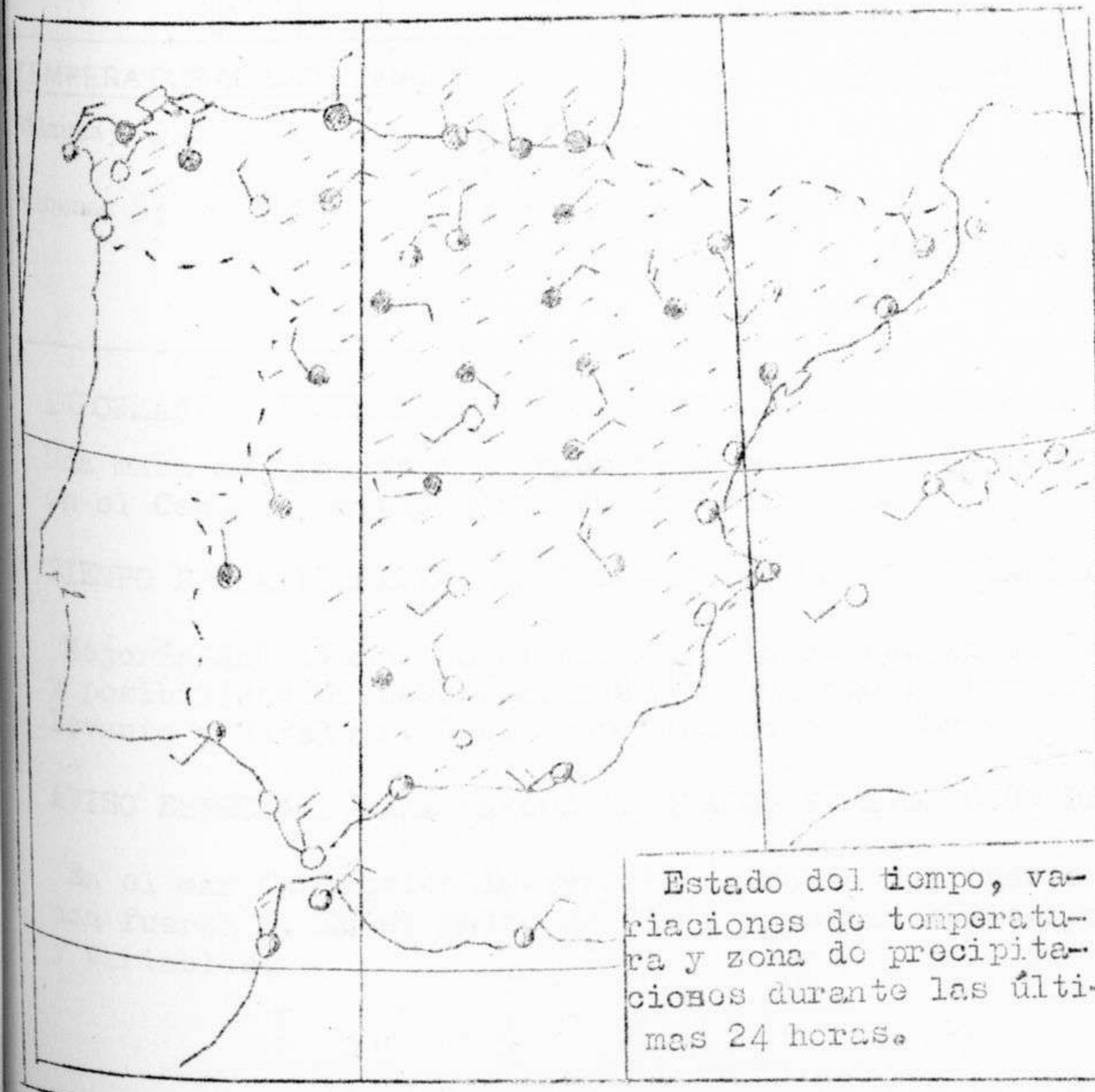
Estado del tiempo, variaciones de temperatura y zona de precipitaciones durante las últimas 24 horas.