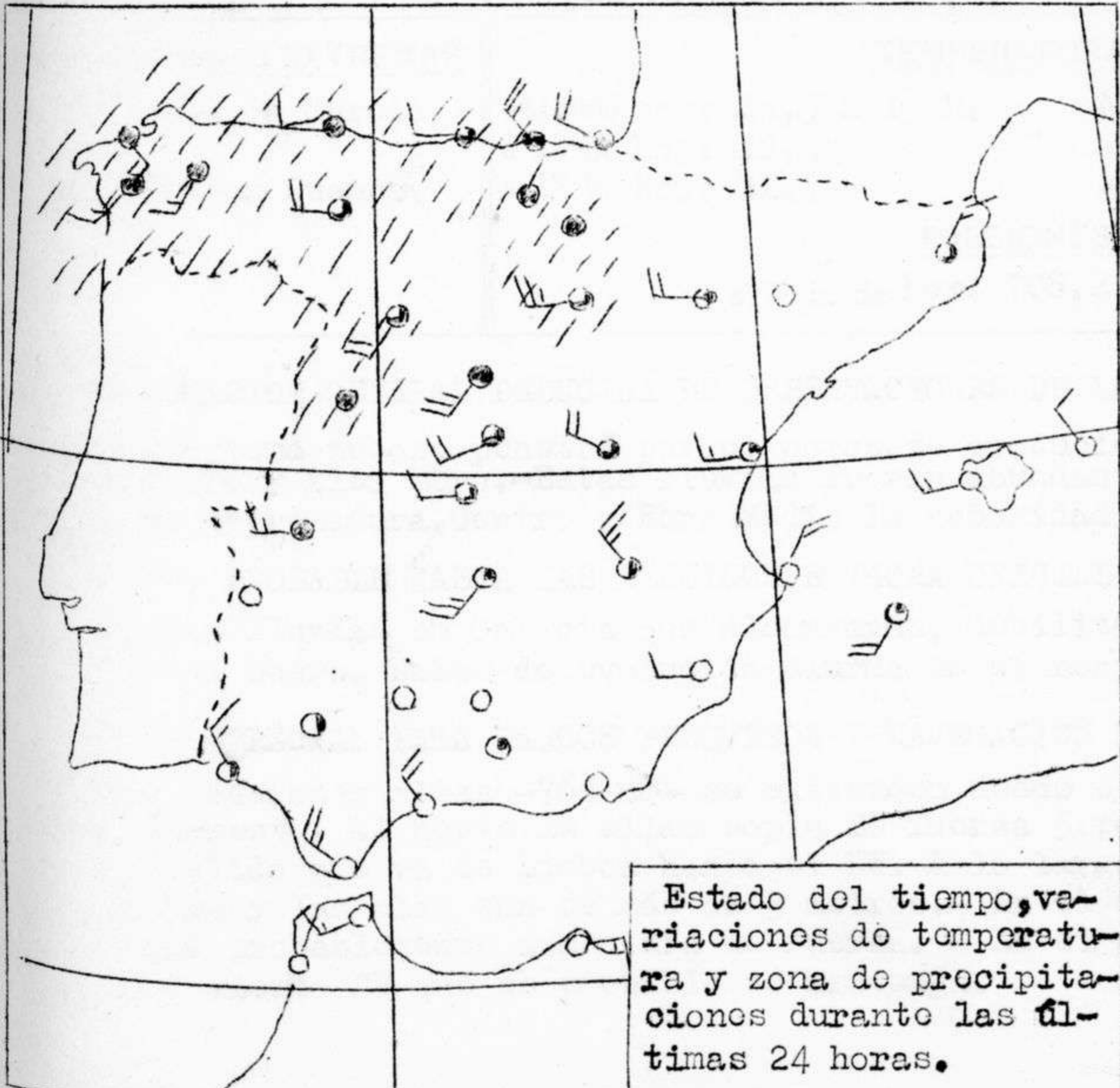
Estado del tiempo, variaciones de temperatura y zona de precipitaciones durante las últimas 24 horas.