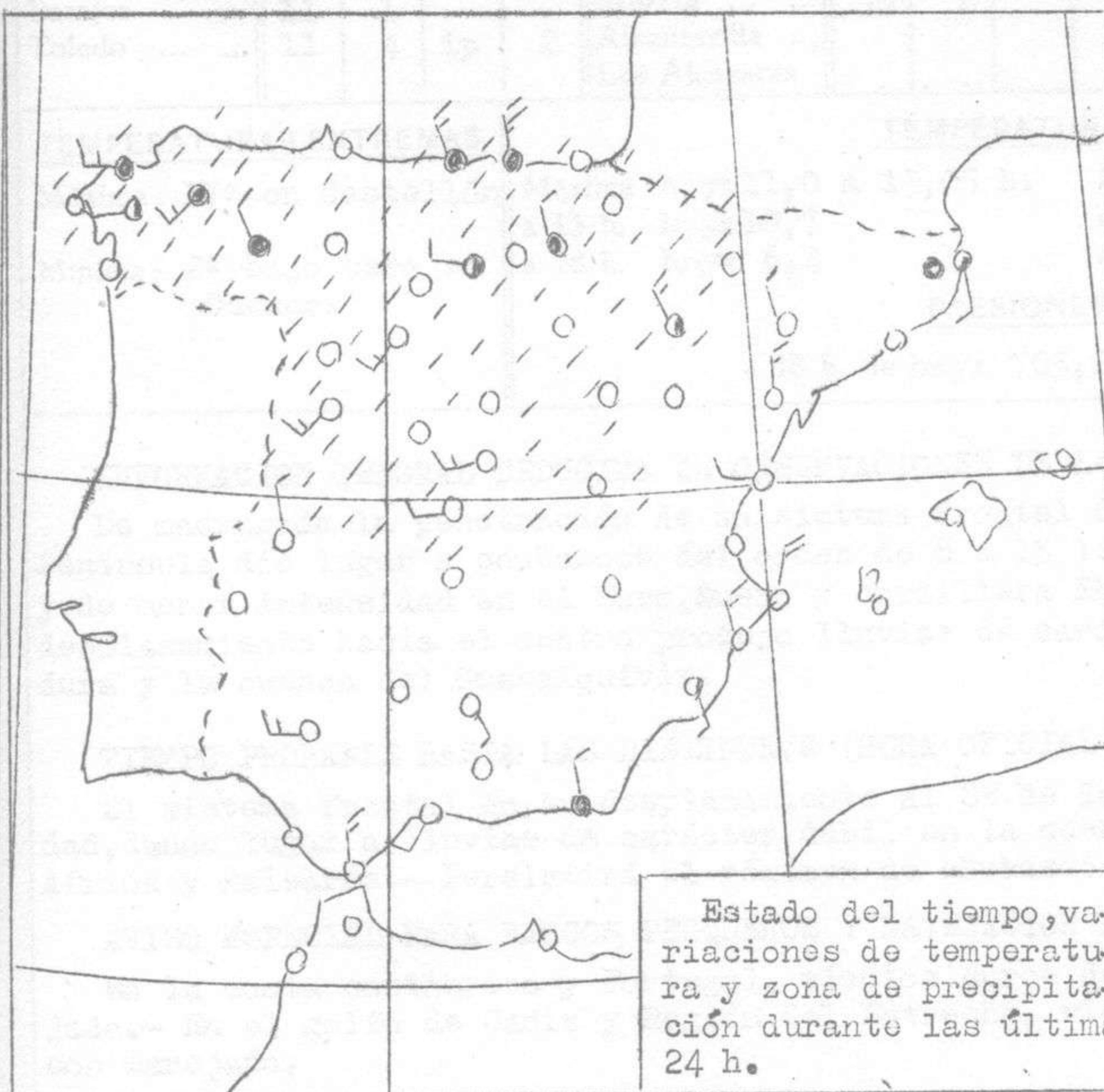
Estado del tiempo, variaciones de temperatura y zona de precipitación durante las últimas 24 h.