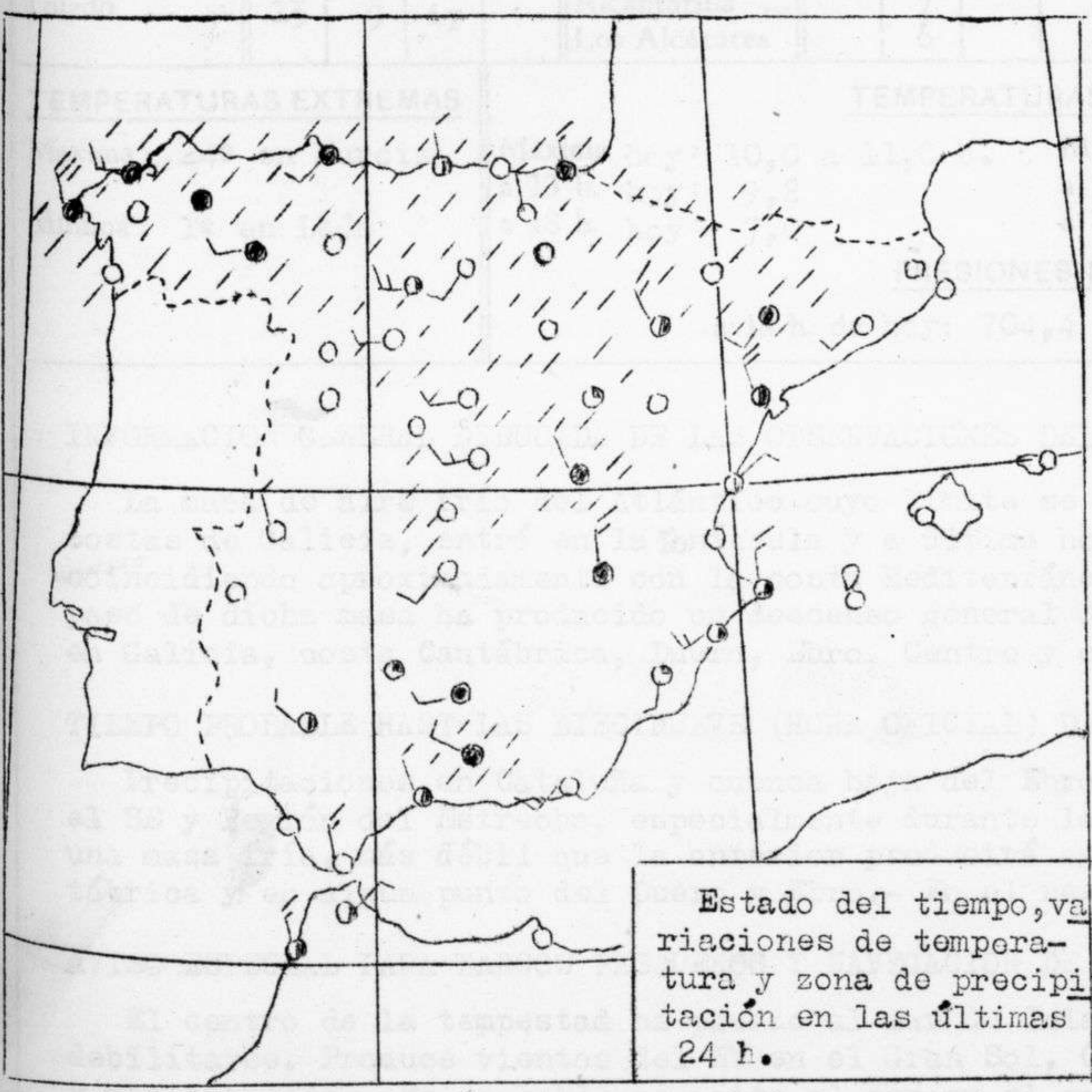
Estado del tiempo, variaciones de temperatura y zona de precipitación en las últimas 24 h.