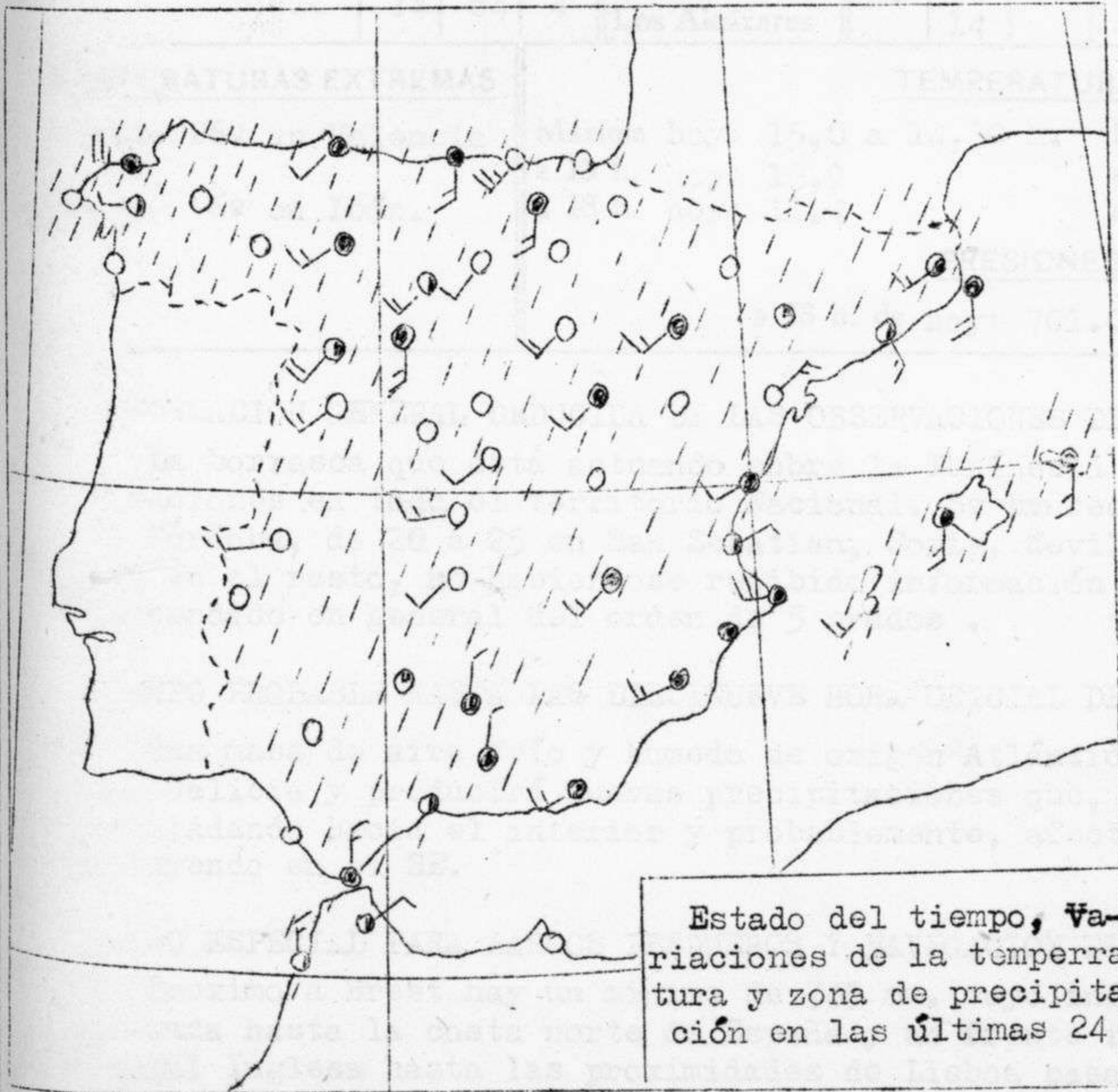
Estado del tiempo, Variaciones de la temperatura y zona de precipitación en las últimas 24 h.