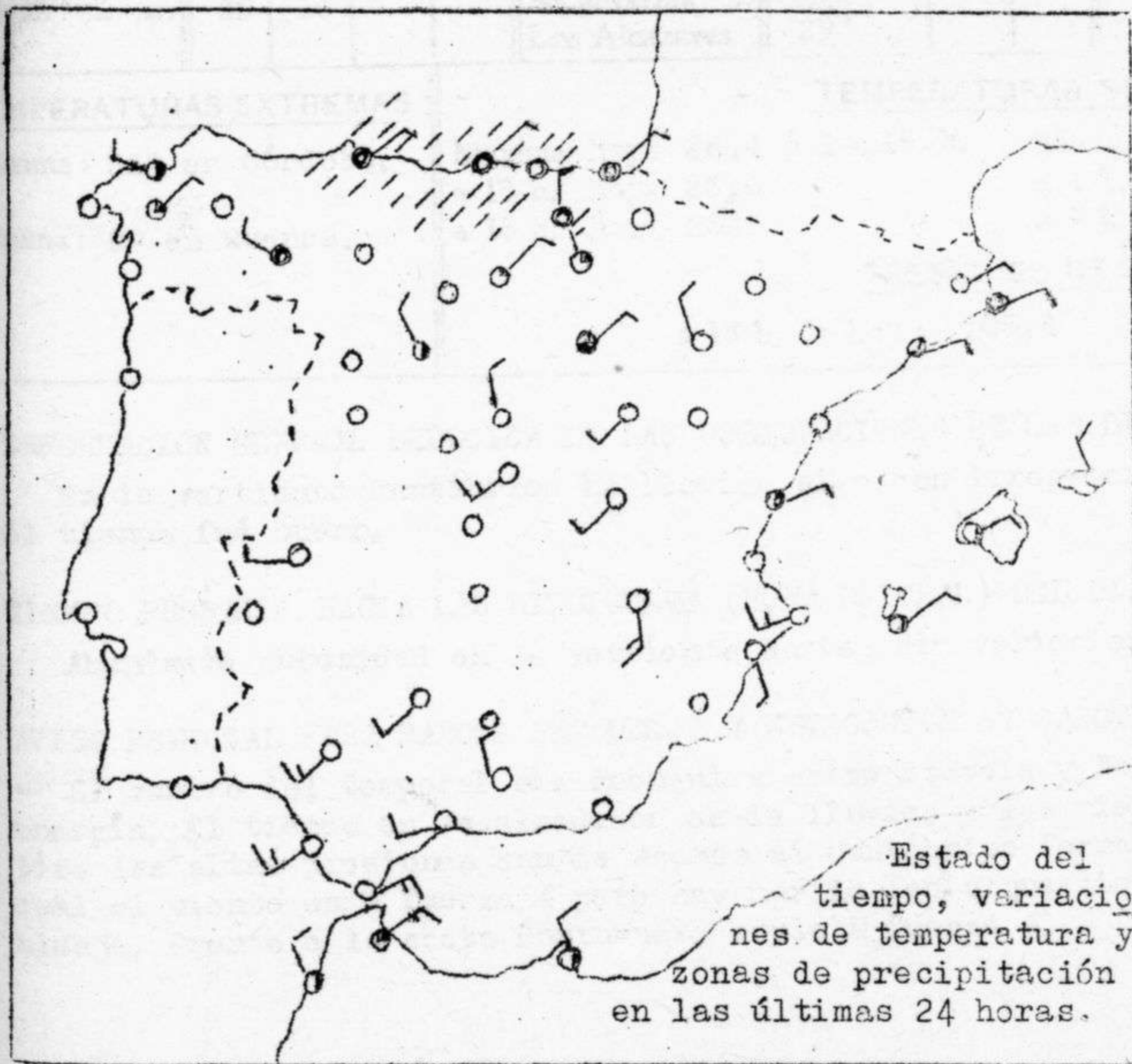
Estado del tiempo, variaciones de temperatura y zonas de precipitación en las últimas 24 horas.