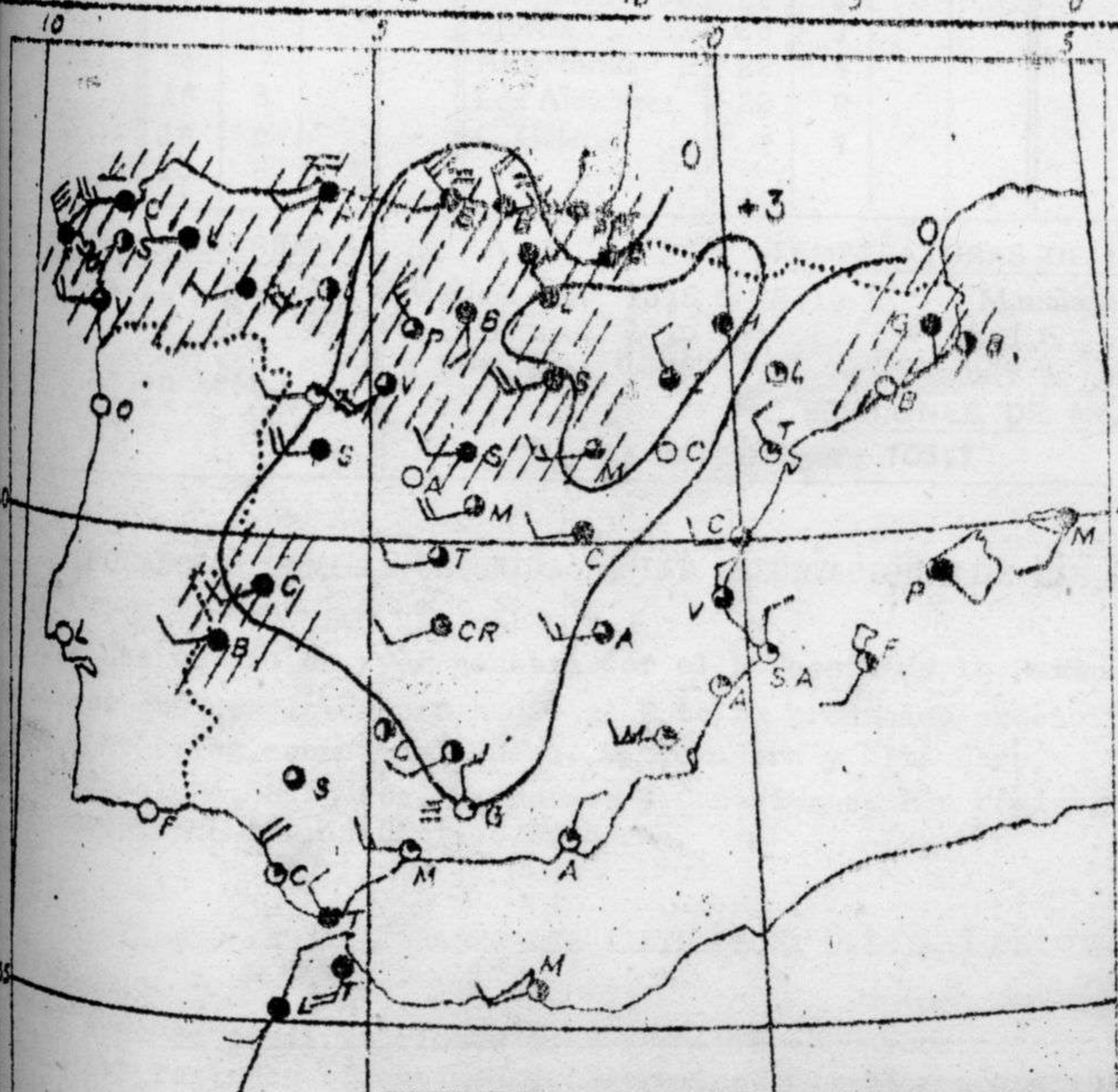
Estado del tiempo, variaciones de temperatura y zonas de precipitación en las últimas 24 horas