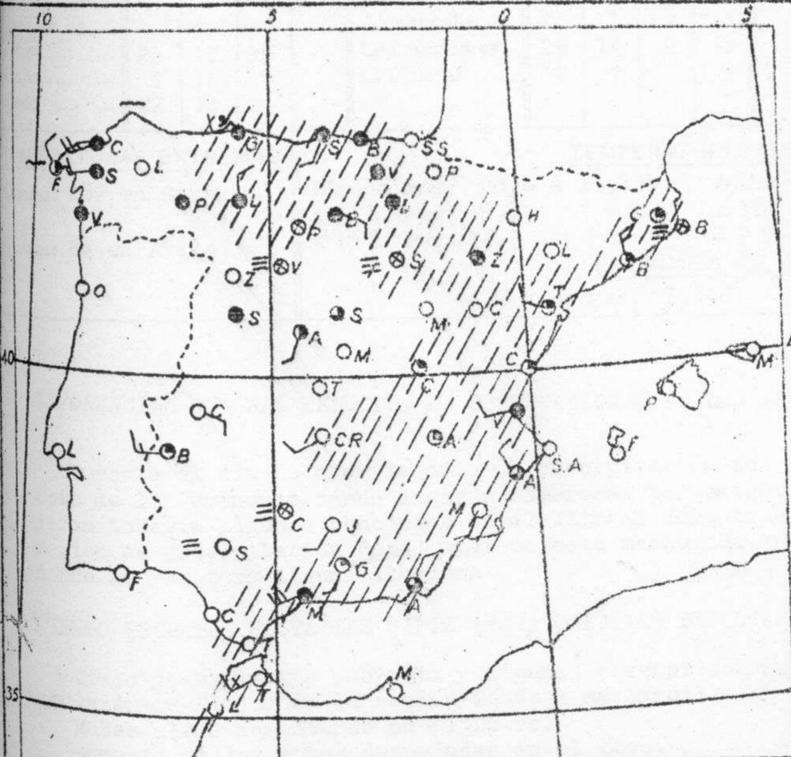
Estado del tiempo, variaciones de temperatura y zonas de precipitación en las últimas 24 horas