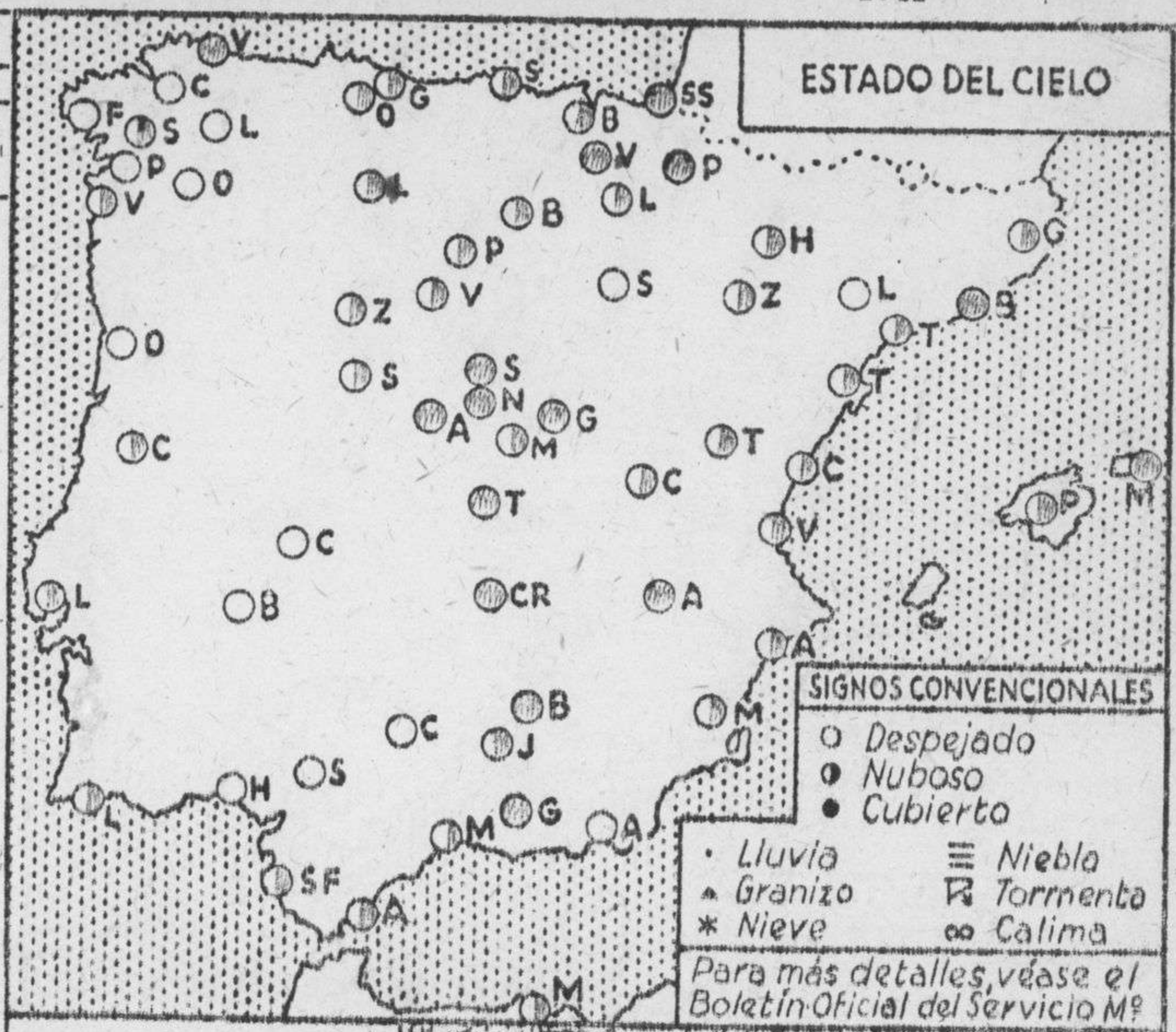
ESTADO DEL CIELO