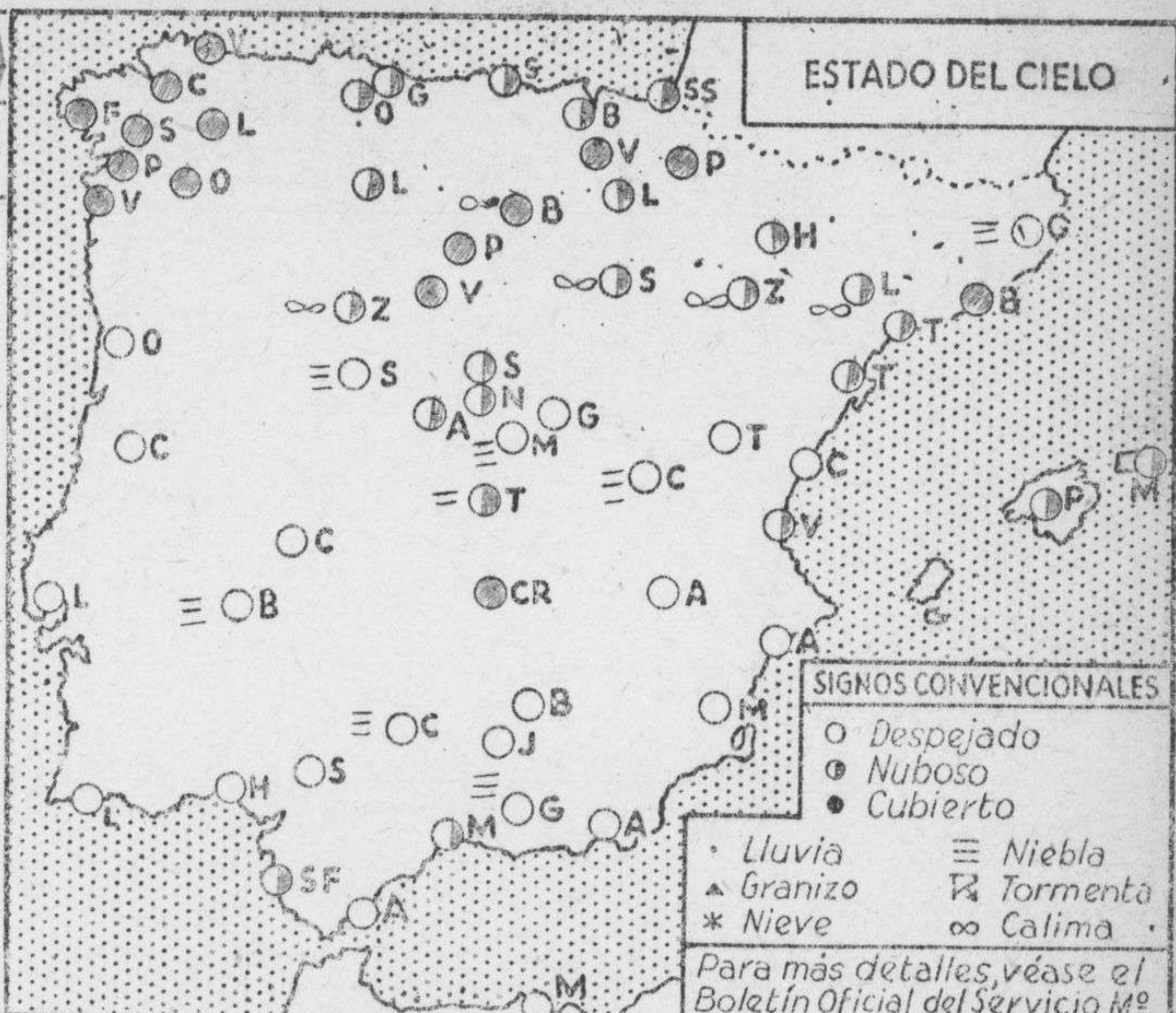
ESTADO DEL CIELO