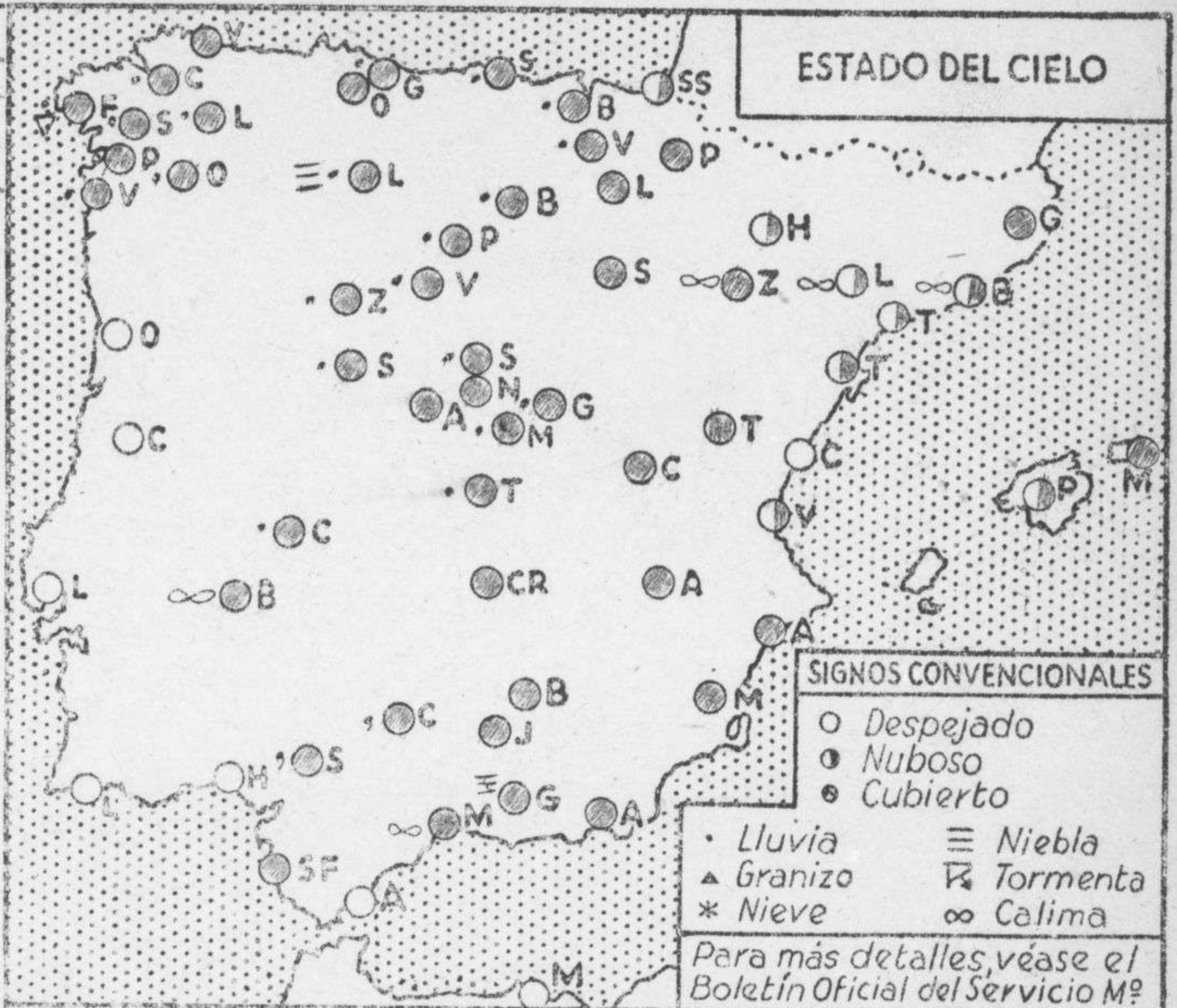
ESTADO DEL CIELO