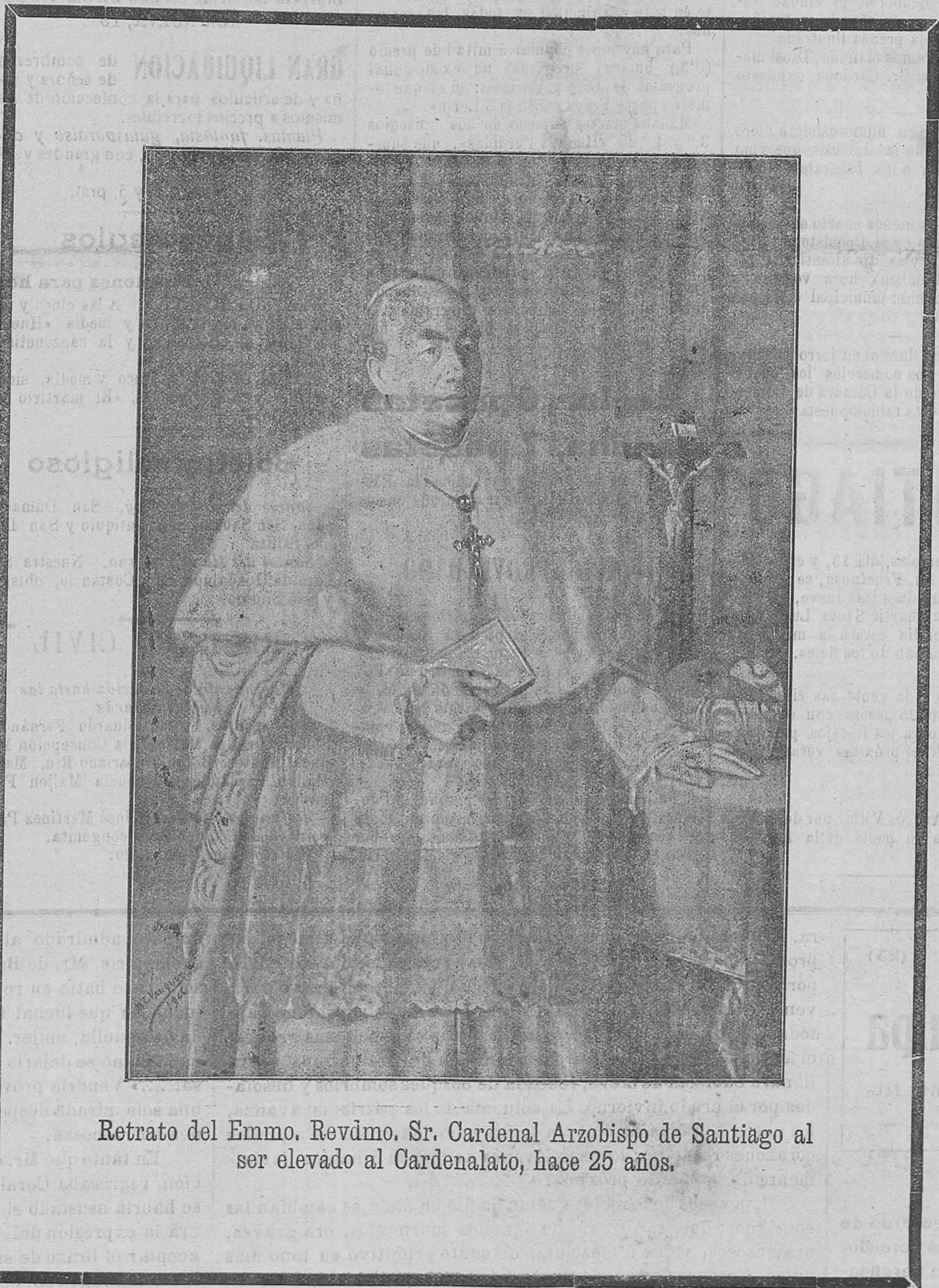
Retrato del Emmo. Revdmo. Sr. Cardenal Arzobispo de Santiago al ser elevado al Cardenalato, hace 25 años.

mente se pensara seguir, al objeto de que el pueblo pueda tomar parte en el acompañamiento y así, desde el Palacio, bajará la comitiva hacia la Plaza de Alfonso XII por el Arco de Palacio, se extenderá hacia el Palacio Consistorial llegando hasta el centro de dicho edificio y luego entrará en la Basílica por la Puerta del Obradoiro a la manera que lo hacían las peregrinaciones que tanto impulsó el finado en los Años Santos.