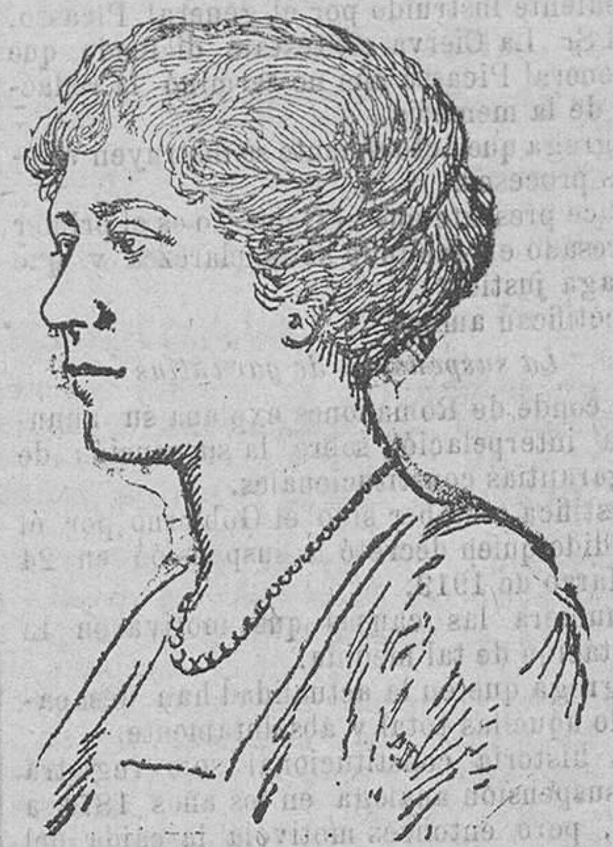
La Princesa Maria, hija de los Reyes de Inglaterra, que ha contraído matrimonio con Lord Lascelles, celebrándose la ceremonia en la Catedral de Westminster.