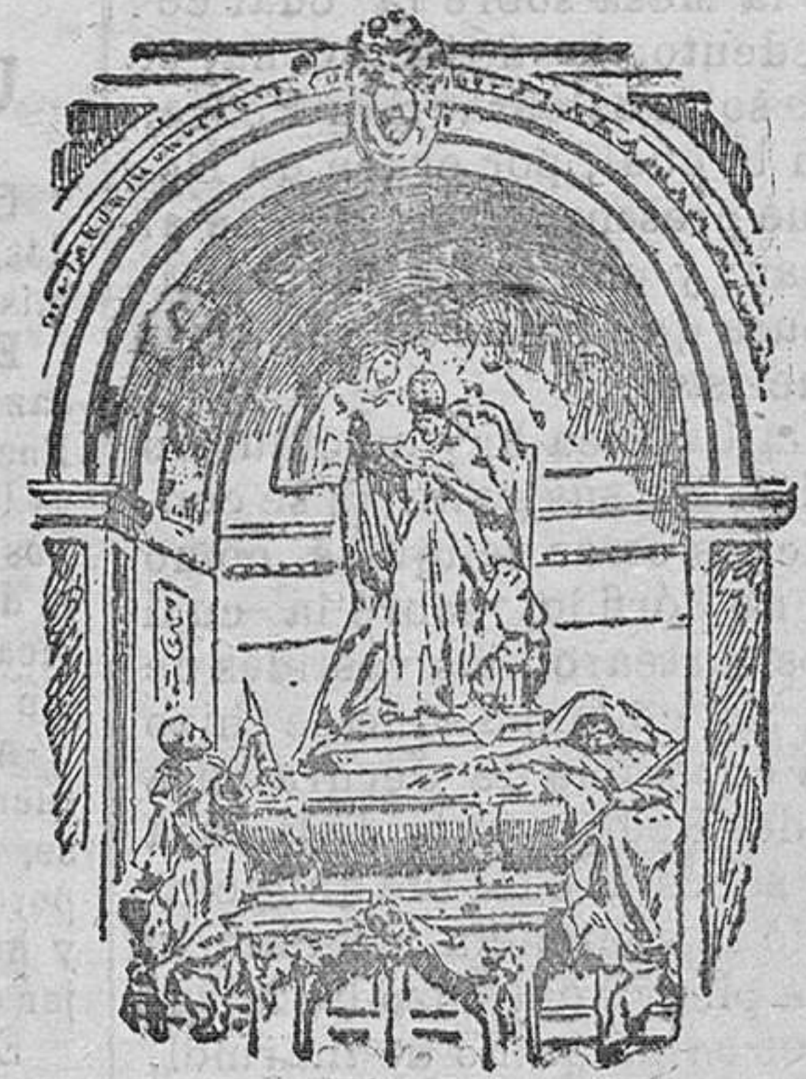
Sepulcro del Papa León XIII

La fachada principal es de gran magnificencia, es obra de Alejandro Galilei (1734). Cinco grandes puertas la del centro flanqueada por dos columnas, dan ingreso a un pórtico que tiene sesenta metros de largo por diez de fondo, sobre este pórtico corre una loggia, que es una de las más bellas existentes de su género en Roma, en la que se abren cinco grandes ventanales que corresponden a las cinco puertas, mantienen el arco del ventanal central cuatro columnas pareadas; desde esta galería, el Papa en las grandes solemnidades daba la bendición al pueblo. De las cinco puertas que dan entrada a la basílica, la de la derecha, es la Puerta Santa, que está tapiada y que se abre únicamente, en los años de jubileo. Ocho enormes pilares y cuatro columnas, que ostentan gallardos capiteles, se alzan en la fachada ocupando dos de sus terceras partes; estos pilares y columnas mantienen el friso, en cuyo cuerpo central, en grandes caracteres, se lee: Christo Sabatori ; en la parte que corresponde a esta inscripción se eleva el timpano, y sobre la cornisa una balaustrada que mantiene doce colosales estatuas de Santos, presididos