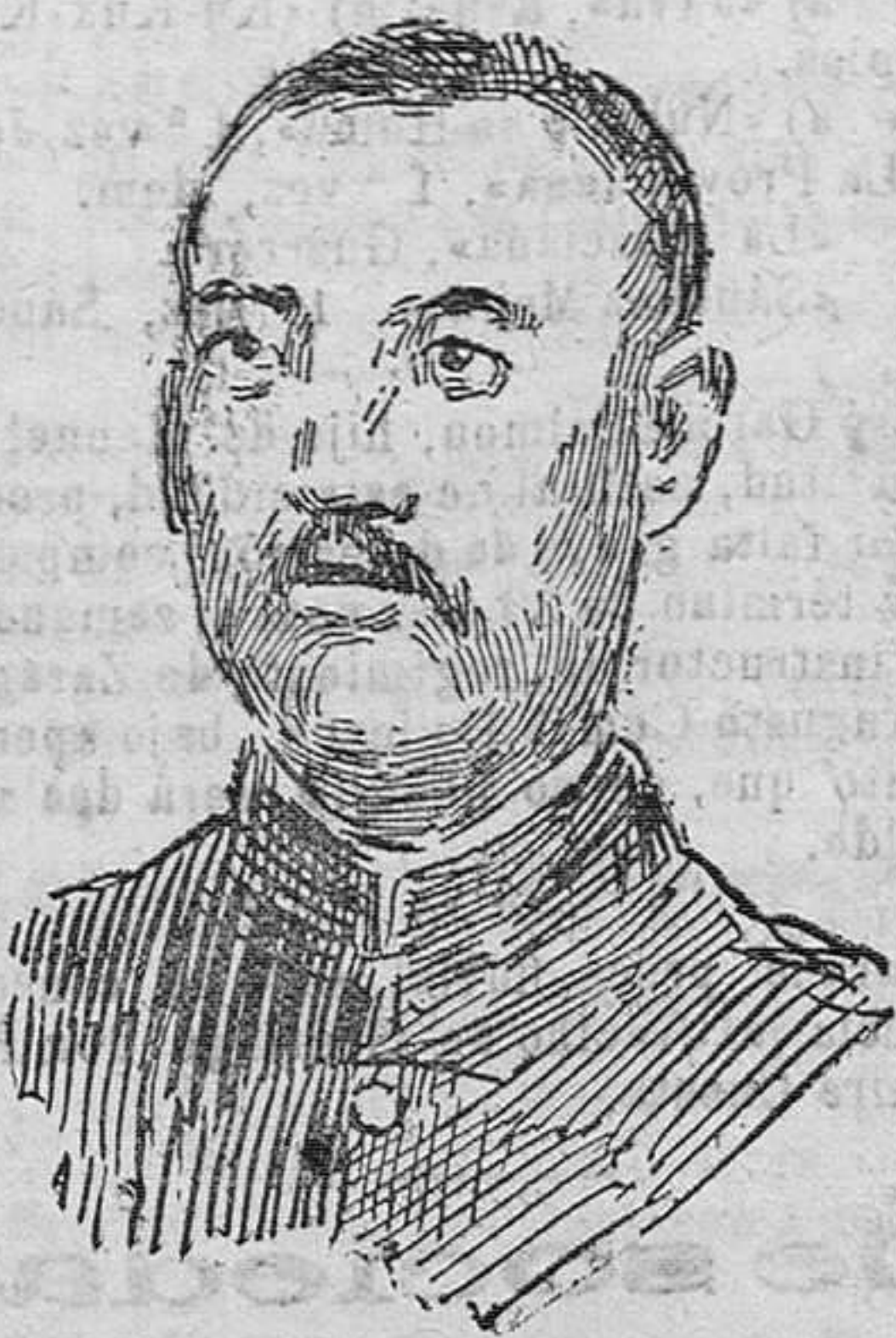
El mariscal chino Chang-Thso-Ling jefe de la rebelión que ha ofrecido cuatro millones de taels, por la cabeza, del presidente de la República.

daderas causas, suponiéndolo un as- paviento hipócrita, tras del que se oculta la aflagaza.