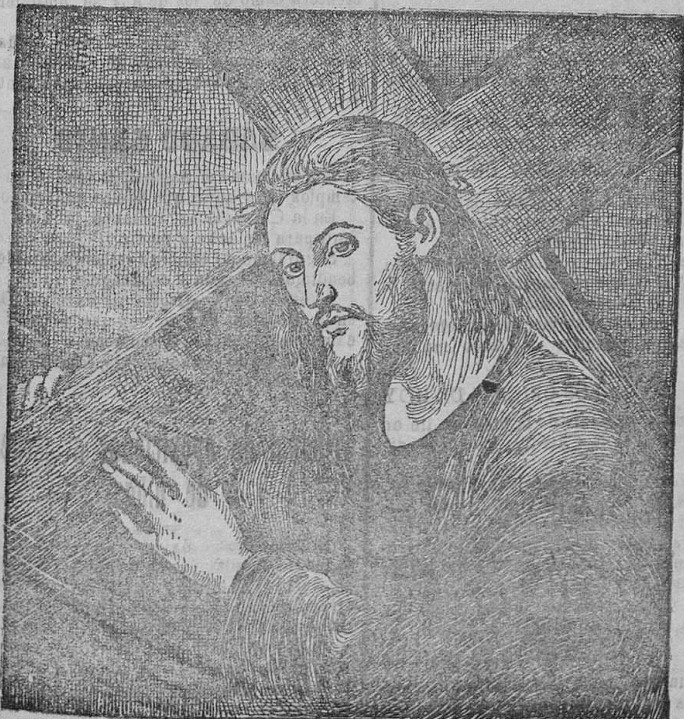
HACIA EL CALVARIO