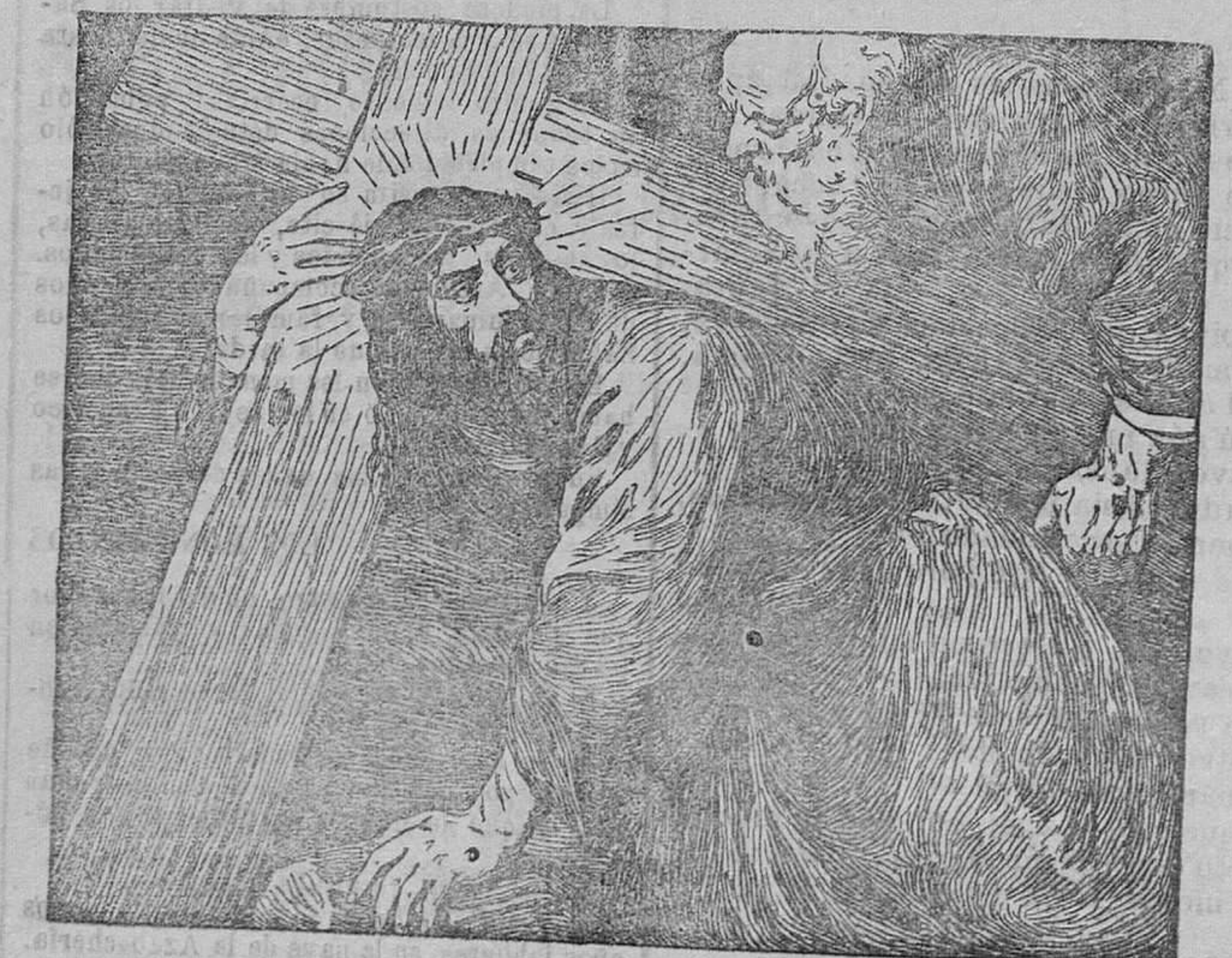
LA PRIMERA CAIDA

Imagen de él son tantos hombres de bien de nuestros días; no persiguen a la verdad pero tampoco toman cartas por ella; creen que lo sumo