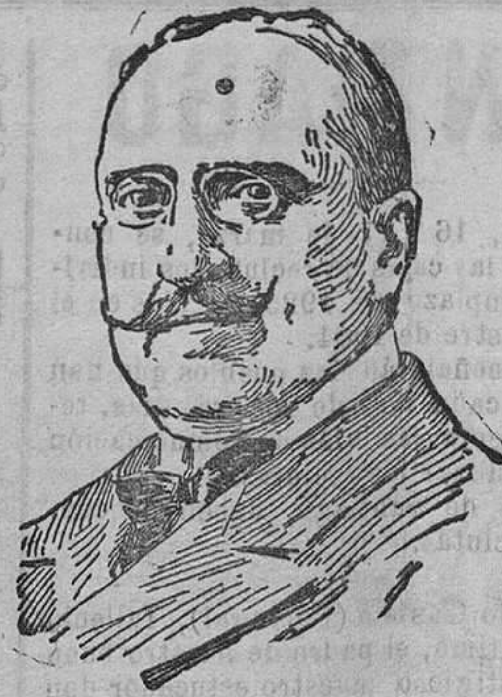
El exministro de Instrucción pública don José del Prado y Palacio que falleció recientemente