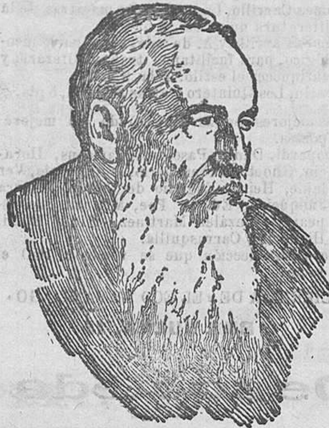
Mr. Nicolás Patchich ex-presidente del Consejo de ministros y jefe del partido radical serbio, que se encuentra gravísimamente enfermo.

vez, observa lo que pasa y se deja galantear de la arroquia.